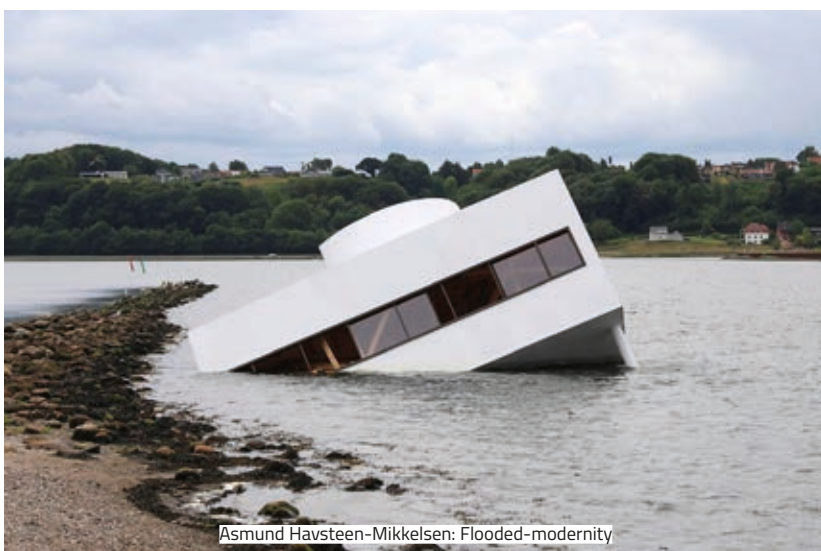
Asmund Havsteen-Mikkelsen: Flooded-modernity

A Vejle Múzeum által megrendezett Floating Art fesztiválon tíz köztéri munkát mutattak be. A legkiemelkedőbb alkotás a Le Corbusier által 1929-ben tervezett Villa Savoye-nak Asmund Havsteen-Mikkelsen által készített 1:1 reprodukciója, amelyet a művész elsüllyesztett a dániai Vejle fjordban. A mű politikai töltetű kritika a brexit (és Donald Trump arról szóló nyilatkozata), valamint a közelmúltbeli választási botrányok, a valószínűsíthető manipulációk kapcsán, de szimbolizálja a modernitás értékeinek elvesztését is.