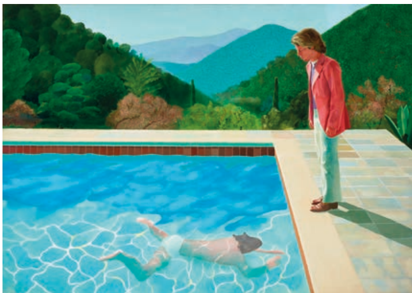
DAVID HOCKNEY: Egy művész arcképe ( Medence két alakkal ), 1972, akril, vászon, 214×305 cm