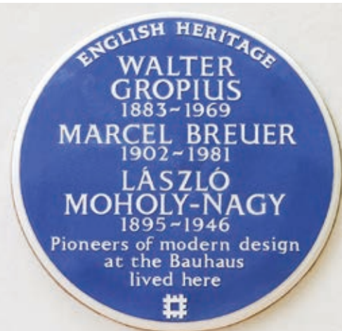
Walter Gropius, Breuer Marcell és Moholy-Nagy László kék plakettje, Isokon Building, London

Emléktáblát avattak a két magyar bauhaus mesternek a brit fővárosban. Moholy-Nagy László és Breuer Marcell londoni otthonának falára került ki kék színű emléklakett, amelyet csak azon kivételes személyek kaphatnak meg, akik megfelelnek a brit örökségvédelmi szervezet előírásainak. Moholy-Nagy és Breuer az 1930-as években Walter Gropius meghívására érkeztek Londonba, ahol az Isokon Buildingben éltek és alkottak.