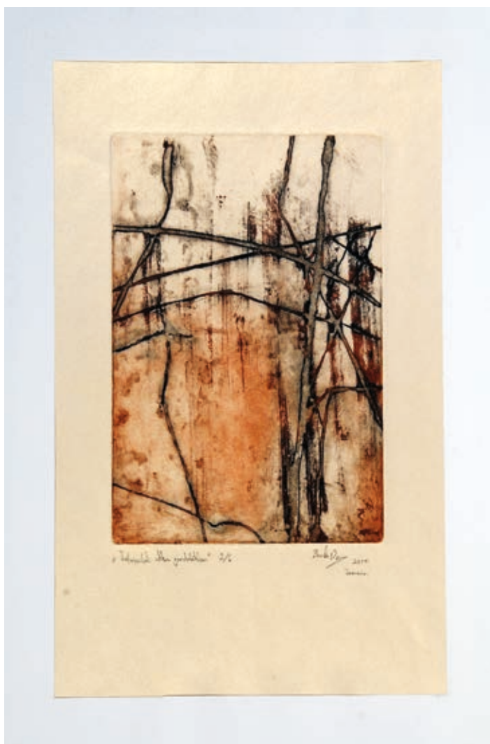
BANKÓ DENIS: Felröpülök akkor egy gondolatban , 2017, foltmaratás, 30x20 cm

A művésztelepi kezdeményezés határozott célja a határainkon túl élő, művészeti felsőoktatásban tanuló magyar anyanyelvű fiatalok szakmai találkozóinak elősegítése, a közös gondolkodás, tapasztalatszerzés, az együtt alkotás lehetőségének biztosítása. Mindez pedig éppen Kiskőrösön, a magyar költészet egyik legnagyobb alakjának szülővárosában.