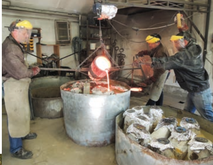
Folyik a bronzöntés

DIÉNES ATTILA: Lóg az eső lába , 2017, fa, 250×200×80 cm