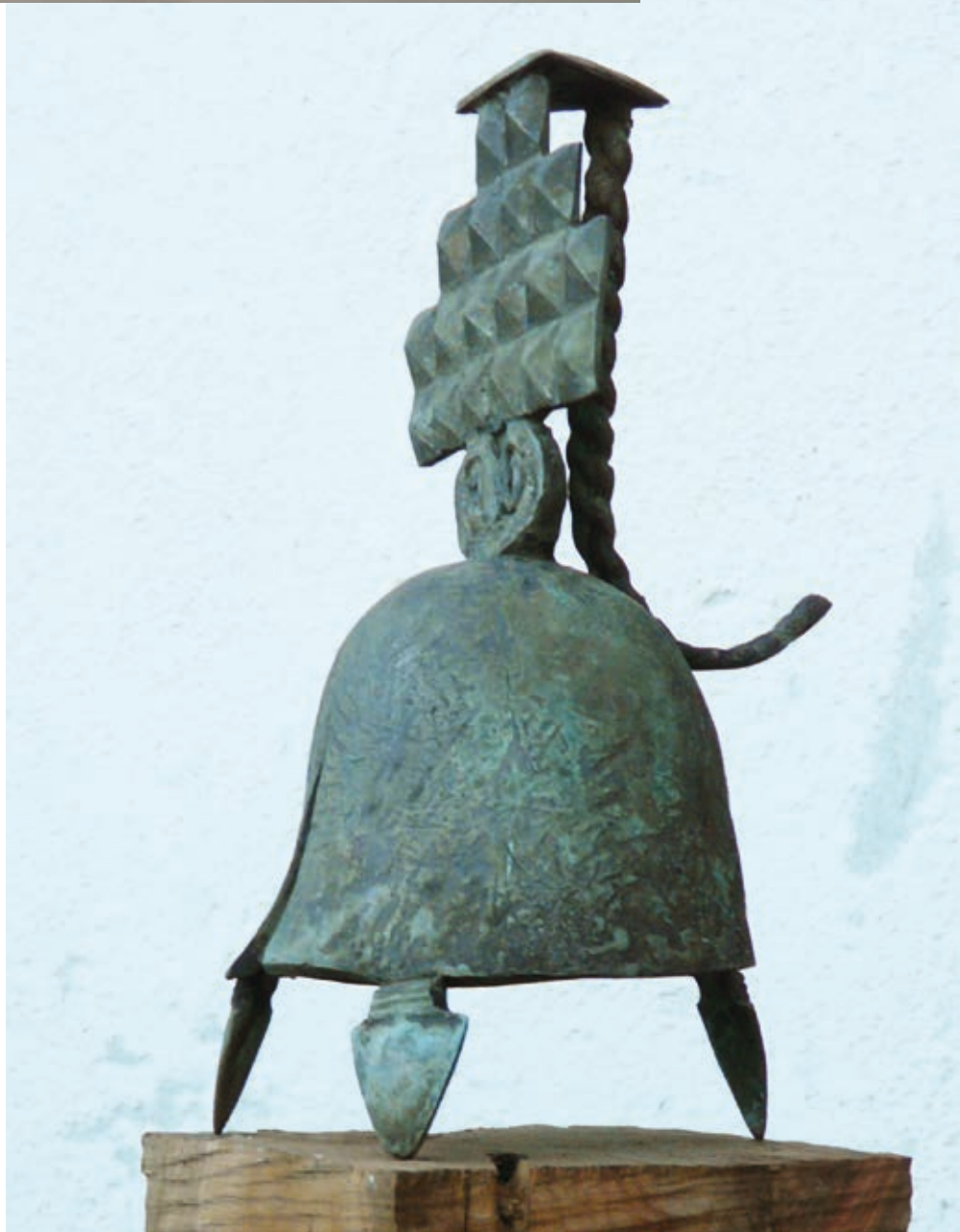
SÁNTA CSABA: Menyecske , 2016, bronz, 22 cm

Magyarpolányt ma már nemcsak a gyönyörű és meredek barokk Kálváriája és népi építészeti emlékei teszik ismertté, hanem az itt készülő és a kiállításon bemutatott művészeti alkotások is.