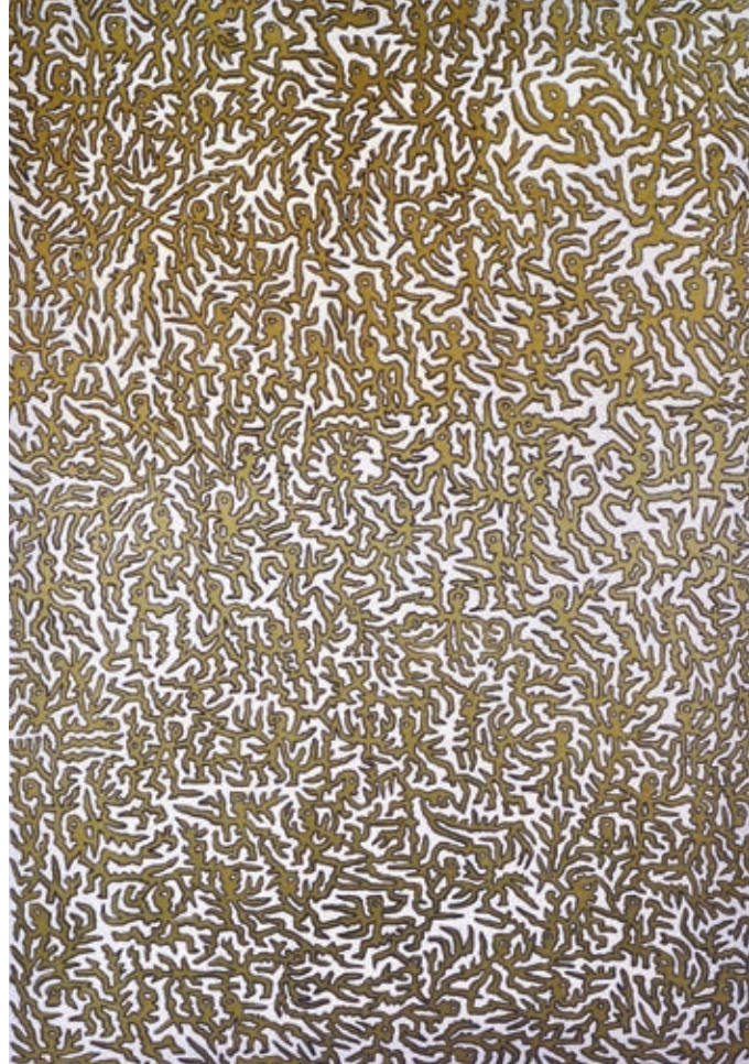
OLAJOS GYÖRGY: Tanácstalanok , 2010, litográfia, 72×52 cm