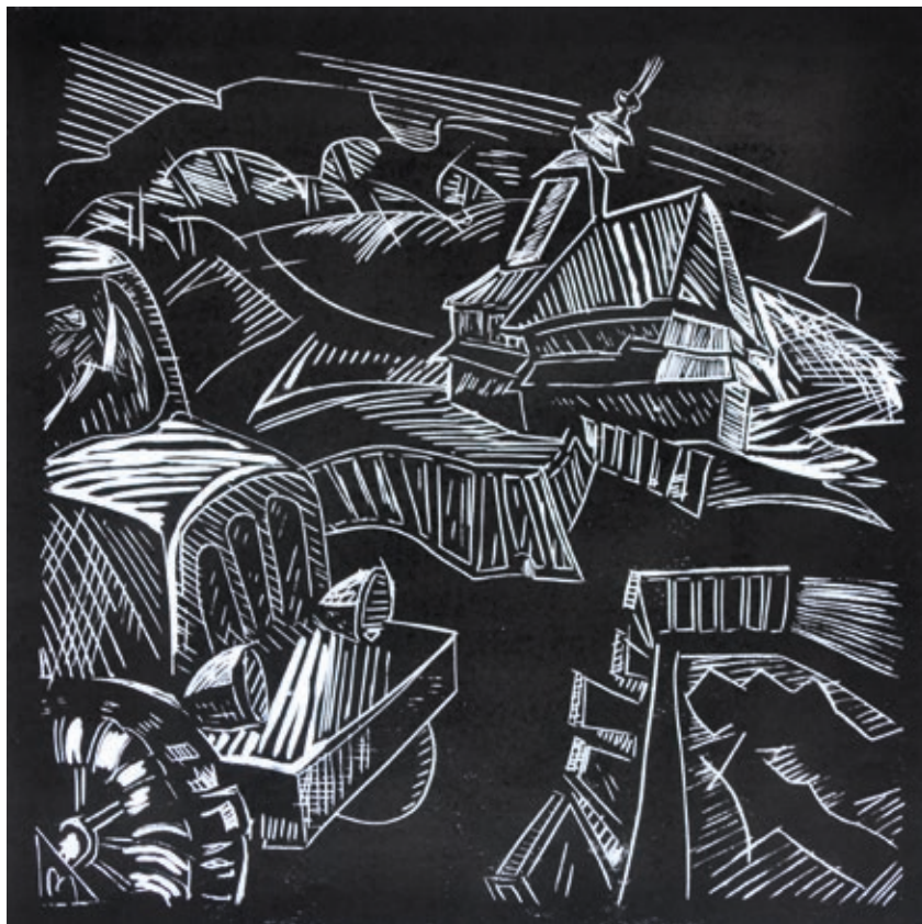
BREZNAY ANDRÁS: Ruski Potok , 2016, linómetszet, 30×30 cm

meggyőződése szerint a szigorú esztétikai minőség, az értékalapú alkotói felfogás egybekapcsol(hat)ja a kifejezési formák akár egymástól lényegesen eltérő megnyilvánulásait is.