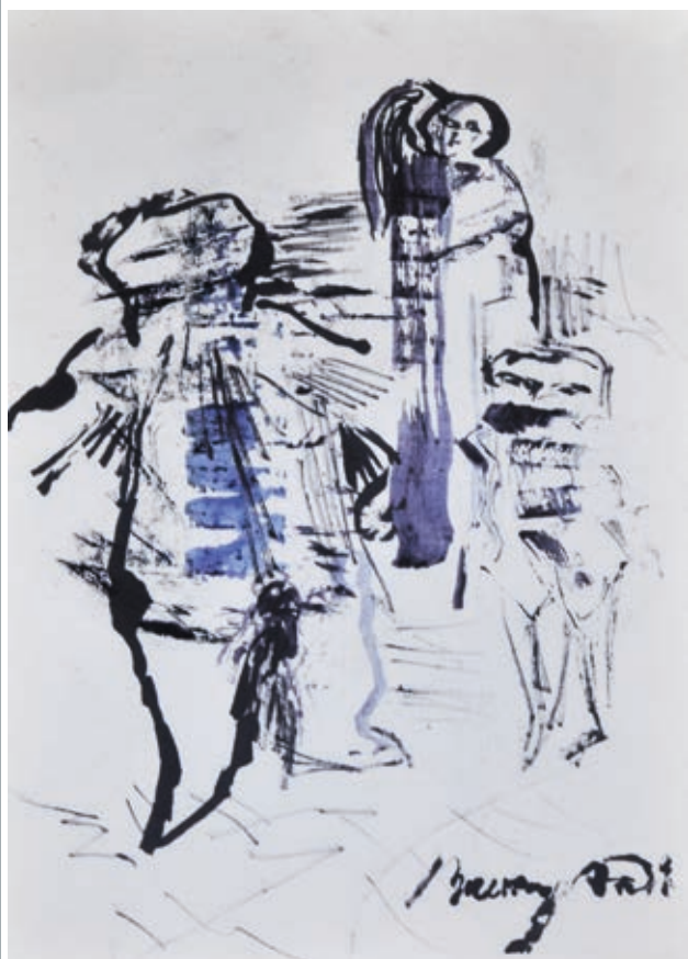
BREZNAY ANDRÁS: Tanácskozás , 1990, tus, 29,4×20,6 cm

és a látványelvű-festői képek is: ezek összessége rajzolja körbe a Lácacsékei Művésztelepet, és a település alakuló kortárs gyűjteményét.