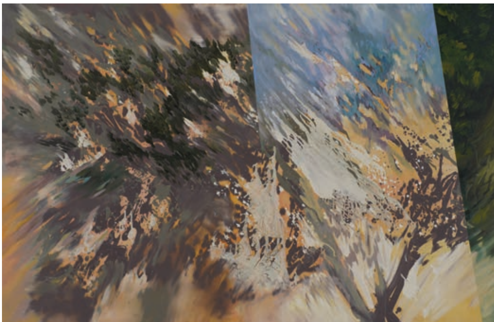
KNYIHÁR AMARILLA: Lombárnyék III. , 2018, olaj-vászon, 130×200 cm