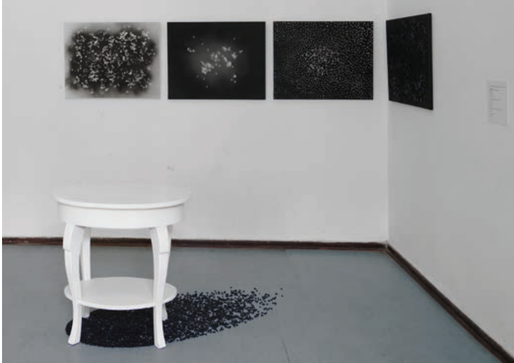
BABINSZKY CSILLA: Seki (Mutual Alive) , 2018, installáció, asztal, bab, akril, vászon, vegyes technika, papír, szöveg, 200×230 cm