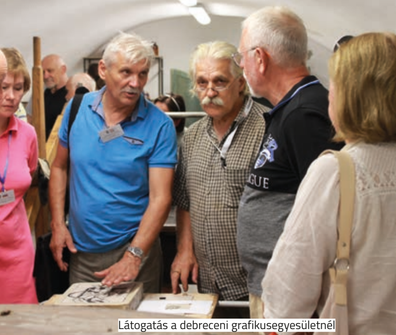
Látogatás a debreceni grafikusgyesületnél