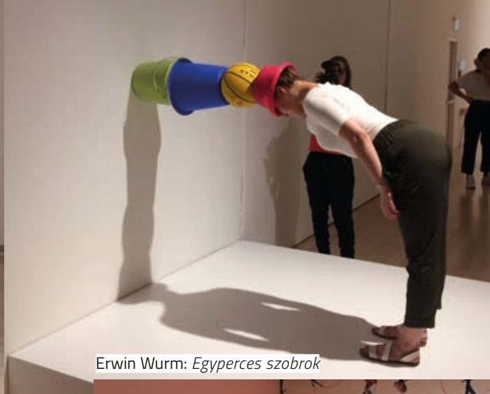
Erwin Wurm: Egyperces szobrok