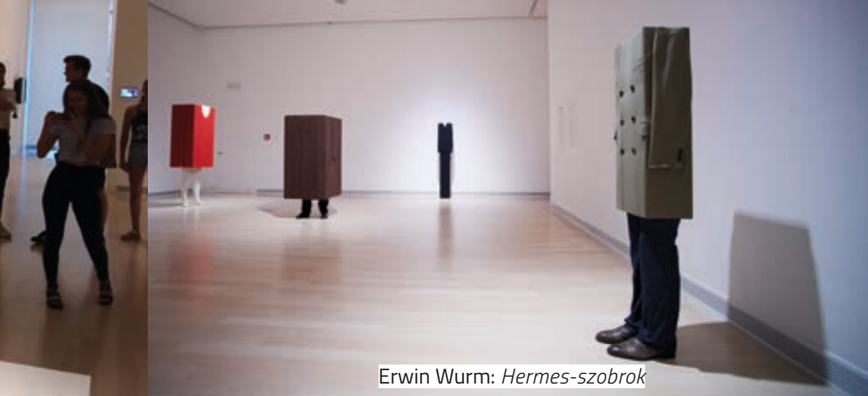
Erwin Wurm: Hermes-szobrok