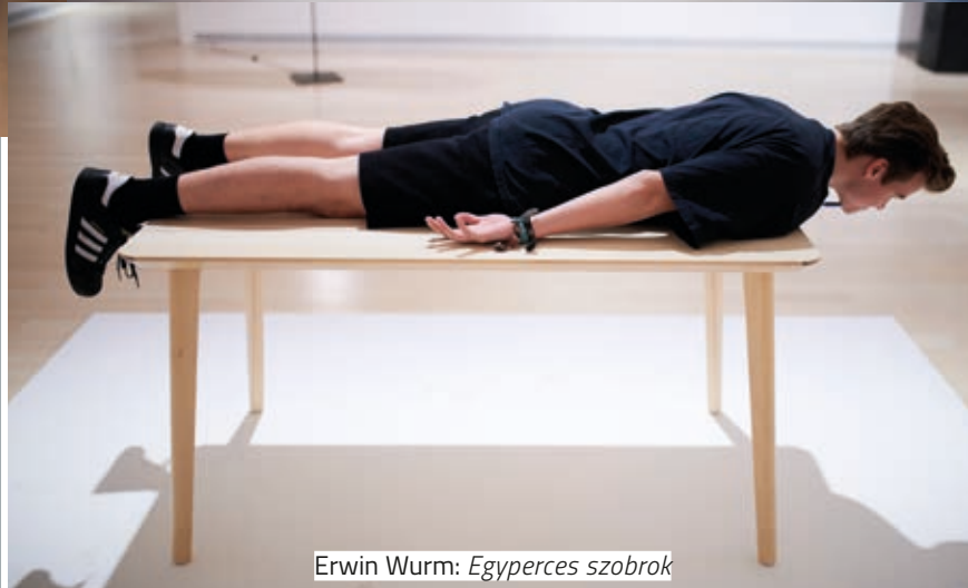
Erwin Wurm: Egyperces szobrok