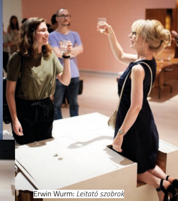
Erwin Wurm: Leitató szobrok