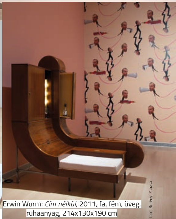
Erwin Wurm: Cím nélkül , 2011, fa, fém, üveg, ruhaanyag, 214x130x190 cm