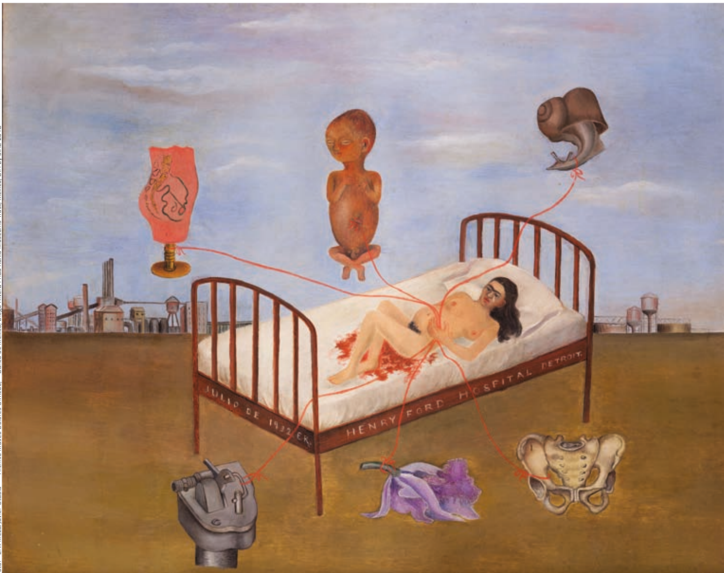
FRIDA KAHLO: Henry Ford Kórház , 1932, olaj, fém, 31×38,5 cm Col. Museo Dolores Olmedo, Xochimilco, México

származású” fotográfusművészt. Újabb kutatások cáfolják az apai nagyszülők aradi (zsidó) illetőségét, amit mindeddig tényként kezeltünk. Legenda vagy valóság? A kiállítás erre is próbált reflektálni. Részint Frida egyik ikonikus fotójával, részint egy meghökkentő dokumentummal.