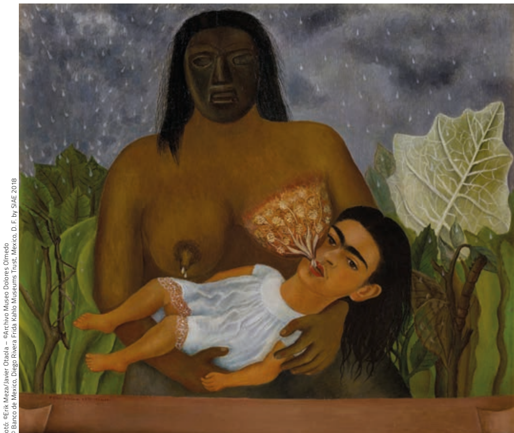
fotó: ©Erik Meza/Javier Otaola – ©Archivo Museo Dolores Olmedo © Banco de México, Diego Rivera Frida Kahlo Museums Trust, México, D. F. by SIAE 2018

hagyhatják a múzeumot – mint Frida Kahlo esetében. Pedig a magát műkedvelőnek tekintő, amatőr festő képeinek zömét nem eladásra szánta, azok ma mégis dollármilliókért kelnek el a legnagyobb aukciósházak árverésein. Mivel a művek csekély száma (körülbelül 250 eredeti alkotás) és nehezen mobilizálhatósága komoly kihívást jelent a világméretű érdeklődés mellett, aligha remélhettem, hogy halálának 50. évfordulójára (2004), illetve születésének centenáriumára (2007) itthon is vendégül láthatunk egy jól előkészített, reprezentatív