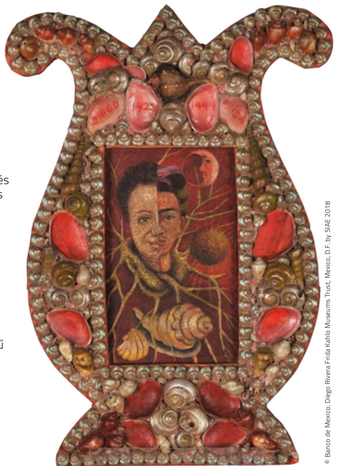
FRIDA KAHLO: Diego és én , 1944, olaj, farost, 12,3×7,4 cm Magángyűjtemény