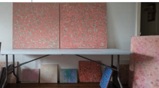
DROZDIK ORSOLYA munkái

A kiállítás visszatekintő jelleggel vonultatja föl Drozdik művészetének archeológiai rétegeit, valamint legújabb munkáit, Sejtfestményeit. Ez a sorozat Drozdik Biológiai metaforák című festményinstalláció-sorozatát idézi föl, amelyet szintén a Budapest Galériában, a Zichy-kastélyban mutatott be 1984-ben.