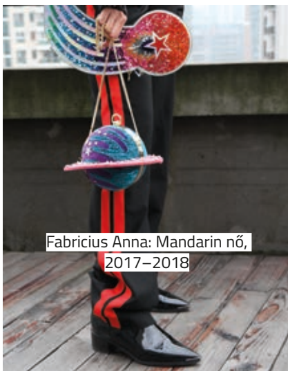
Fabricius Anna: Mandarin nő , 2017–2018

Fabricius Anna fotográfus témaválasztásaiban visszatérő motívumként jelennek meg a női szerepek, tevékenységek, attribútumok. Az elmúlt két évben tett ázsiai utazásai során érdeklődése a fiatalok gyors stílus- és öltözkékváltásain, a fogyasztási cikkek cseréin keresztül megfigyelhető öndefiníció, újfajta identitáskeresés felé fordult. A Mandarin nő című kiállítás darabjai elsősorban Sanghajban, a kínai divatfővárosban készültek.