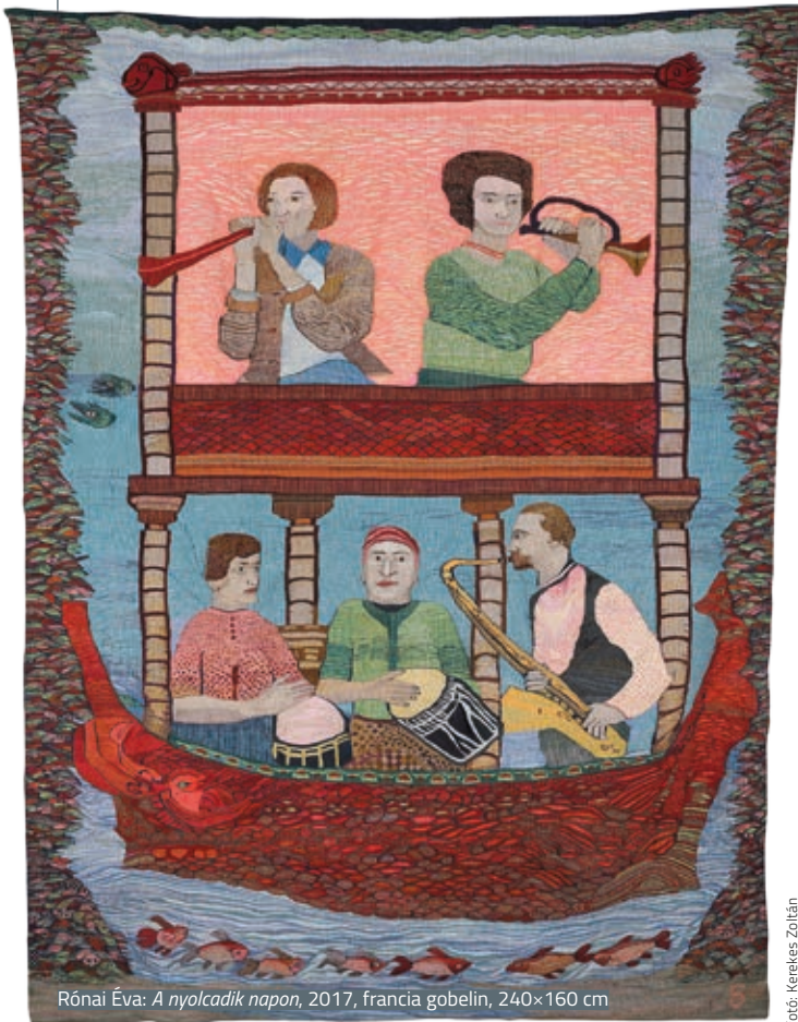
Rónai Éva: A nyolcadik napon , 2017, francia gobelin, 240×160 cm

Párnacsata – ez a címe egyébként az alkotásnak, ami alkalmat adhatna arra, hogy a textil fontosságát a valódinál lejjebb szállítsa, pedig erről jelen esetben nincs szó. A puha anyagok, lágy fonalak művészete valójában kőkemény dolog volt Magyarországon az utóbbi ötven évben, a művek az első évtizedekben gyakran kiverték a biztosítékot a funkcionáriusok irodáiban, s még gyakrabban kiverték volna, ha a textilesek nem vonultak volna el szívesen olyan távoli helyekre, mint (a Szombathelyhez egyébként igen közeli) Velem, ahol viszonylag nyugodt körülményeket tudtak teremteni az alkotáshoz. De amikor megjelentek a nyilvánosság előtt, akkor igencsak felkeltették a figyelmet maguk – a műveik – iránt. Ilyen volt mindjárt a kezdet is: 1968-ban az Ernst Múzeumban a Textil – Falikép '68 című kiállítás, amely eseménynek