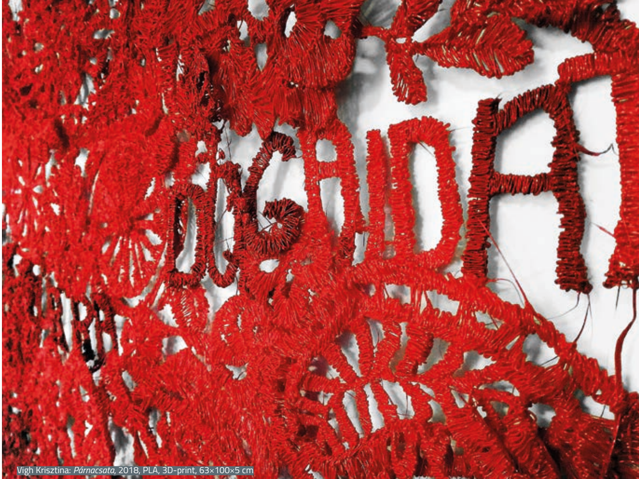
Vigh Krisztina: Párnacsata , 2018, PLA, 3D-print, 63x100x5 cm