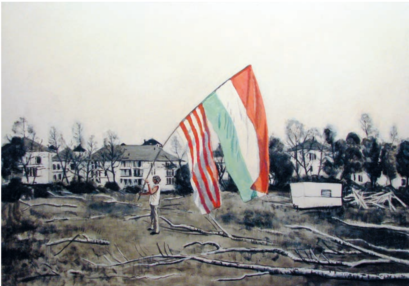
NEMES CSABA: Flaneur , 2008, olaj, vászon, 140x200 cm, HUNGART © 2018

Nádlernek van egy alkotása – a két nemzeti zászló egyedien összekötve – a Gyulai Román Gimnázium aulájában, amelynek az átadását egy nagy román–magyar politikai eseményre várták korábban, de az sohasem következett be – szerencsére a mű azért ott látható.)