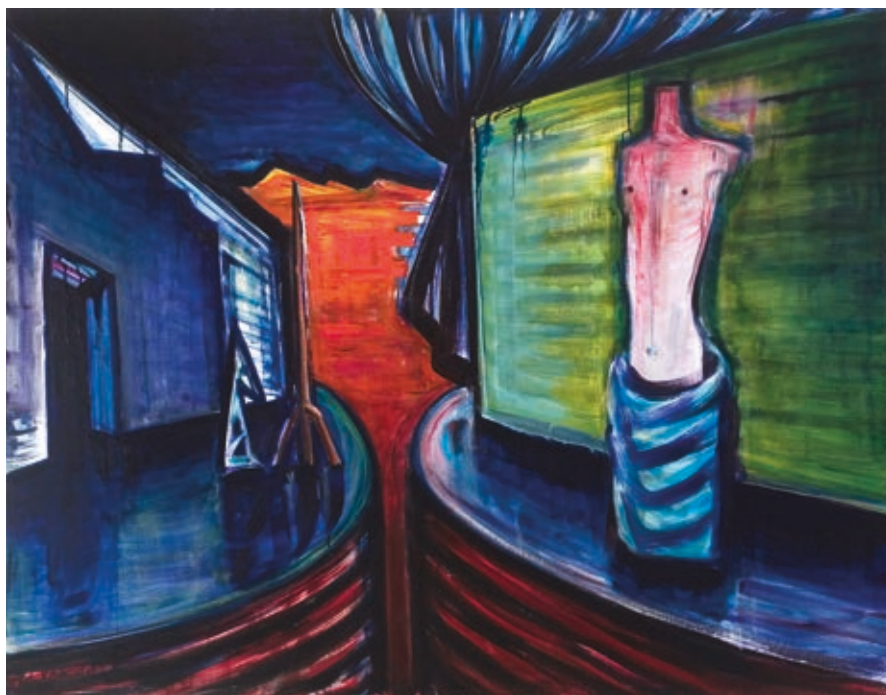
EL KAZOVSZKIJ: Állat a színházban , 2000, olaj, vászon, 100×130 cm, HUNGART © 2018

Gondolati tételekre bontva tárta elénk kollektívját. Vágyak és emlékek álcázva a címe annak az egységnek, ahol El Kazovszkij műveit prezentálja. A hat olaj vagy vegyes technikával készült táblakép tematikája az ismert motívumokhoz kötődik. Teátrális közegben jelennek meg égi kísérőink ( Angyal Ostia falai előtt ), az állati torzók és kedvenc vándora ( Fej nélküli hattyú, Vándorállat Vénusszal, Állat a színházban ). Két olajképen az egyensúlyozás