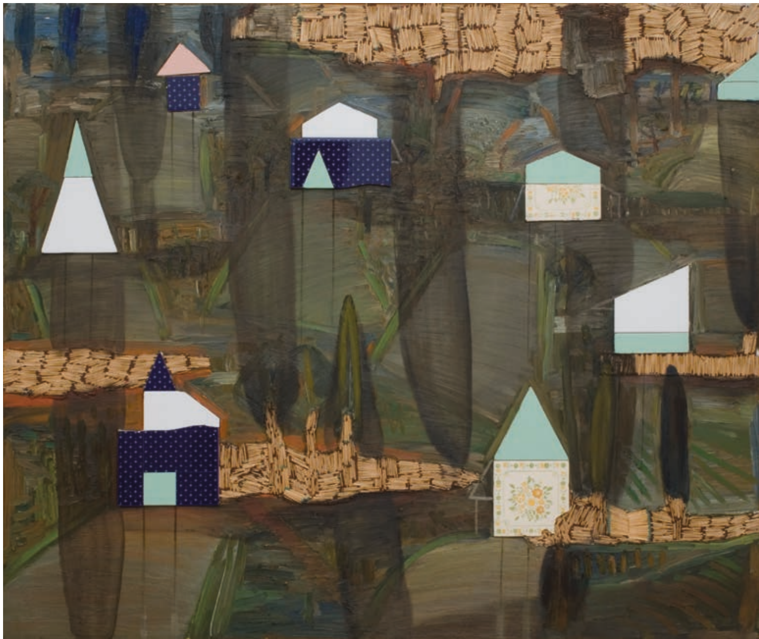
BUKTA IMRE: Kövesdi domboldal , 2000, olaj, applikáció, rétegelt lemez, 125×150 cm, HUNGART © 2018

Imrere gondolok, akik bár különböző alkotók, mégis van valami közös bennük, mindketten a posztindusztriális világ élethelyzeteit emelik be egy mitikus térbe. Kazovszkij jobban vonzódik az elemeltséghez, s ettől válik minden képe egy kietlen tájjá, ahol a gazdáját vagy netán istenét vesztett állatok s persze az ember kőborol, míg Buktánál a realitás beemelése a művek terébe, a régi és új életmódok keveredése mutat fel afféle elszervetlenedést az életünktől.