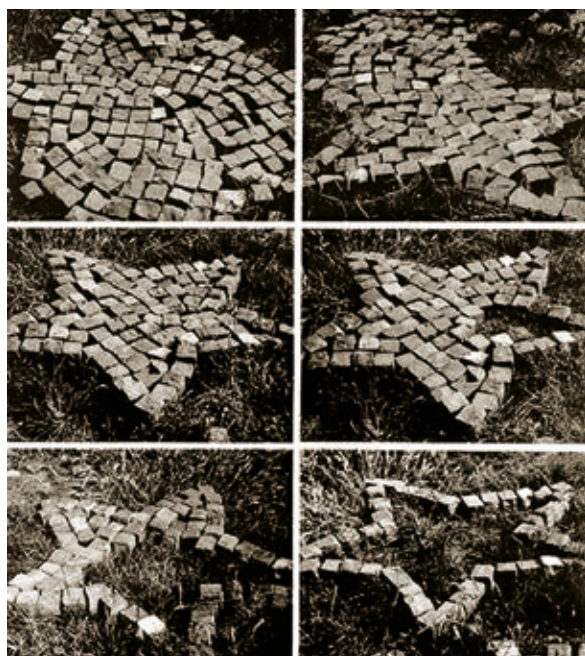
PINCZEHELYI SÁNDOR: Csillag (utcakő), 2012, fotó, papír, egyenként 40x50 cm