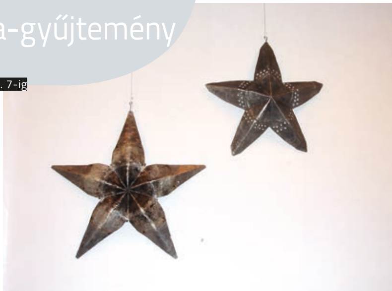
TEODOR GRAUR: Csillagok , 1991, alumínium, Ø 60 cm és Ø 50 cm HUNGART © 2018

A gyűjtő az, aki saját esztétikai ítéletei alapján válogat össze műveket. Ő az, aki kimozdítja az egyes alkotók kollekciónjából a sokaságba belesimuló alkotásokat, és új kontextusba helyezi azokat. Ő az, aki egyáltalán nem önzetlenül, de mecénása a kortárs művészetnek. Míg magának örömet okoz, vásárlásaival elősegíti az új művek születését. Egyrészt helyet csinál az új alkotásoknak, hiszen a hiánnyal katalizálja az alkotókedvet, másrészt hozzájárul az alkotó életben maradásához, ami, valljuk meg őszintén, mégiscsak elengedhetetlen az új művek születéséhez. De a műgyűjtő egyben alkotó is. Ő az, aki képes