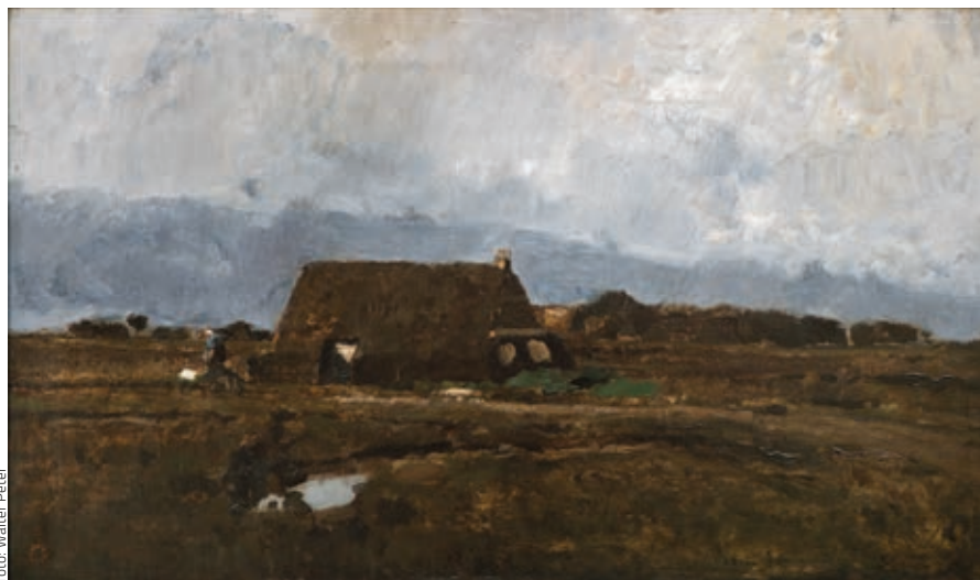
Fotó: Walter Péter

figyelemfelkeltő, befejezetlen vagy félbehagyott műveket. Ilyen Az Úton című, 1870–71-ben készült kompozíció, melyen még az előrajznak és előfestésnek jutott főszerep, de az alkotó fokozatosan áttért a folszerű festői eljárásra. Az olyan Fontainebleau-ban készült képek, mint a Fények az erdőben , illetve az Erdő napsütésben , fontos bepillantást engednek alkotói módszerébe, hiszen 1875-től, a párizsi modern törekvések, elsősorban az impresszionista festők működésének eredményeképpen oldottabb, folszerűbb modellálást kezdett alkalmazni. Ez a megoldás elősegíti a fény- és árnyékeffektusok hitelesebb rögzítését, de továbbra sem tesz engedelményeket a pillanatnyiság illúziójának. A Természet katedrálisában című tárlat alapján fogalmat alkothatunk 19. századi tájképfestészetünk egyik legjelentősebb mesterének a barbizoniak körében betöltött különleges helyéről, s a kortársak között egyedülálló törekvéseibe is betekintést nyerhetünk.