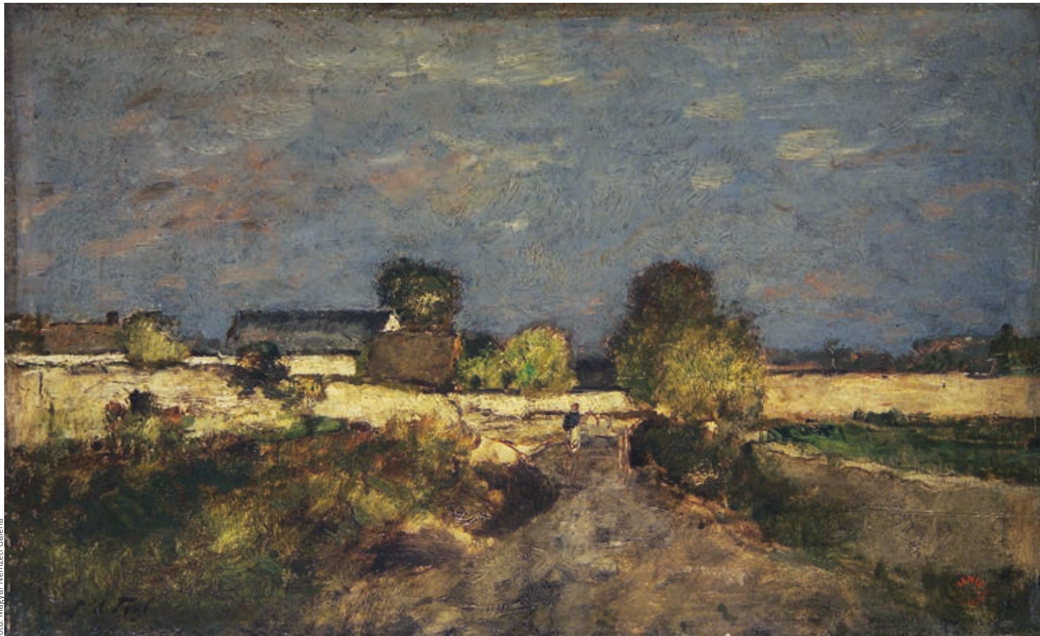
PAÁL LÁSZLÓ: A párizsi erődítések környéke , 1874, olaj, vászon, 34x55,5 cm Magyar Nemzeti Galéria

levetkőznie. Az 1870-es és a következő évi szünetidőben a hollandiai Beilenben töltött tanulmányúton készült képek – Faluvége , Tájkép (Fasor tehennel) , Felhős táj – előadásmódja egyre szabadabbá, oldottabbá vált. A Naplementén már érzékelhető a tájképfestés közbeni barangolások alatt a festőt ért közvetlen benyomások, spontán impulzusok az élmény hevületében történő, lendületes rögzítésének az igénye.