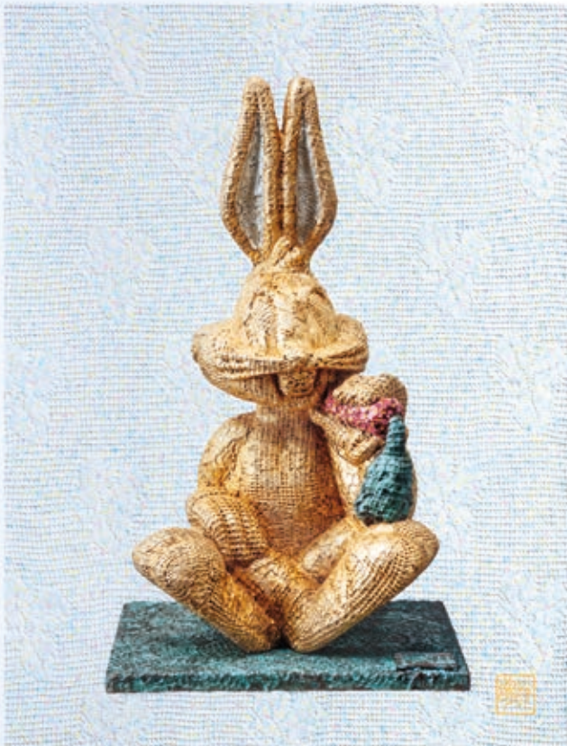
HAVADTÖY SÁMUEL: Cím nélkül , 2018, giclée-nyomat, akril, 92×70 cm

műveiről, melyek jelentős része továbbra is „eredetiként” szerepel jelentős gyűjteményekben. A több mint hatvan álnevet használó, az Egyesült Államok és Európa között folyamatosan az egyik társadalmi eseményről a másikra utazgató Hory Elemért végül letartóztatták, csalásért elítélték és börtönbe zárták. Nem mindennapi élettörténetét először amerikai barátja, Clifford Irving jegyezte le 1970-ben. Arról a Clifford Irvingról van szó, akit később a világtól elzárkózva élő Howard Hughes hamis önéletrajzának elkészítéséért bebörtönöztek. Hory Elemér maga is szerepelt Orson Welles 1973-ban bemutatott, H mint hamisítás című filmjében. A festő hírnevének köszönhetően a gyűjtők hamarosan elkezdtek keresni a saját aláírásával szignózott műveket, amelyek meglehetősen jó áron keltek el.