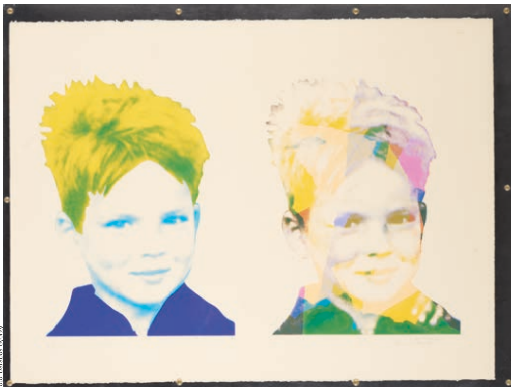
HAVADTŐY SÁMUEL: Cím nélkül , 1985, szíatechnika, akril, 55×75 cm

kezdeti fázisban általában – rövid, velős, enigmatikus, néha politikai, gyakran fájdalmasan személyes – üzeneteket festett a vászonra. Ezeket azután csipke- és festékrétegekkel borította, amivel valójában olvashatatlan palimpszeszteket hozott létre. Maga a csipke, amelyet a művész szisztematikusan gyűjt, titokzatos médiummá vált, amely egyszerre mutatja meg és rejt el a dolgokat. Továbbra is nagyon érdeklik az anyag finom jelentésszárnyai, például a szerelem és a házasság, a fenség és az elegancia, a nőiesség és az erotika, akárcsak a csalás és az álcázás, a tragédia és a gyász. (Ezen a ponton eszünkbe jut Andy Warhol Jackie Kennedyről festett portréja: Chanel-kosztümjén férjétől származó vérfoltok, haját fekete csipkefátyol fedi.)