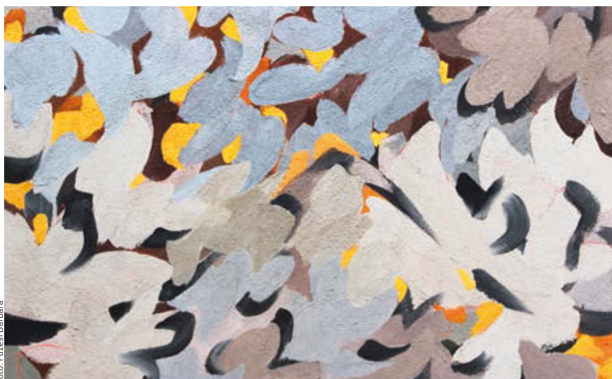
RÁKOSSY ANIKÓ: Sárga reflexek , 2018, olaj, vegyes technika, vászon, 100×140 cm

Mindig is úgy gondoltam, hogy Rákossy Anikó világnézetét két sarokpont képezi: a családi értékek iránti elkötelezettség és a természethez fűződő különleges kapcsolat. Mindezt azonban kiegészíti az a kitartó munka és az a cselekvő szeretet, amelynek nyomait újabb és újabb festményei őrzik.