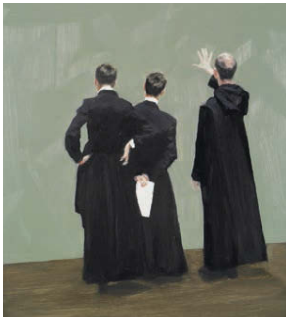
TIM EITEL: Szerzetesek , 2009, olaj, fatábla, 27,9×25,4 cm

A már korábban nyitott kiállítások továbbra is láthatók a fesztivál keretén belül, így például a Nincs több titok! – Válogatás Gerő László gyűjteményéből című tárlat (MűvészetMalom, április 8. – augusztus 26.). Szintén