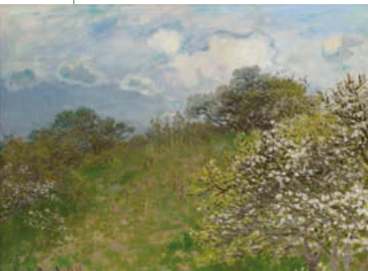
CLAUDE MONET: Tavaszi , 1875, olaj, vászon, 73x55 cm