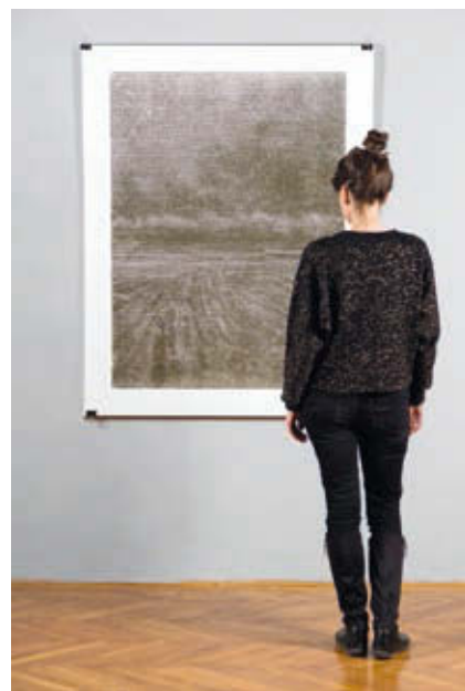
STEFAN OSNOWSKI: ENTRE 4. , 2018, fametszet, papír

Stefan Osnowski, aki magát nyomatkészítőként határozza meg, legújabb, ENTRE – átmenet című sorozatában háromszögekből álló rácsszerkezetű alakítja a felületet, amely geometrikus, közelről szemlélve absztraktnak mondható hálónak alakul. Fametszeteinek kiindulópontja a látható világ egy-egy rögzített pillanata, ahol az egymást keresztező vonalak metszéspontjában megjelenő pontok a digitális fotók pixeleire hasonlítanak. A nagy méretű, monokróm fametszeteiken Európa legnyugatibb részének, Portugália déli partjának üres tájait láthatjuk, amelyeket széles határtalanság jellemez. A képek szigorú alapelve, hogy a fókusz a tenger végtelen horizontján a távolban, pontosan a kép középpontjában jön létre. A művek a teljes feloldódás képei, amelyek egyfajta köztes, átmeneti állapot érzetét keltik a nézőben az ég és a tenger, a nappal és az éjszaka, a világgosság és a sötétség, a folyamatos mozgás és a teljes nyugalom közötti láthatatlan határvonalon táncolva. A művész a fotográfiákat egy hosszadalmas alkotói folyamat során digitális metszőkódba transzponálja, majd fába metszi, végül kézzel készíti el a papírra nyomtatott levonatot.