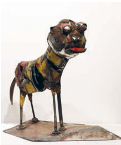
PONYICZKI SZILVIA: Hypnagóg lény , 2017, hegesztett fémhulladék, 48×24,5×42,5 cm