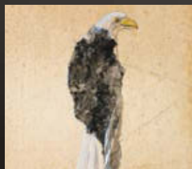
SUPRA. 2015 karton, akvarell, tempera, tus (részlet)