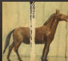
MENNYDÖRGÉS. 2009 karton, akvarell, tus (részlet)

A HUNGART 2009 óta jelenteti meg kismonográfia-sorozatát, amely kortárs képző-, ipar- és fotóművészek munkásságát dolgozza fel. A HUNGART-könyvsorozat hiánypótló a vizuális művészeti szakmában és a hazai művészeti könyvpiaccon. A könyvsorozat hozzájárul a jelenkori magyar művészet dokumentálásához, szellemi értékeinek megőrzéséhez, valamint hazai és nemzetközi megismertetéséhez.