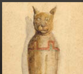
BASZTET. 2008 karton, akvarell, tus (részlet)