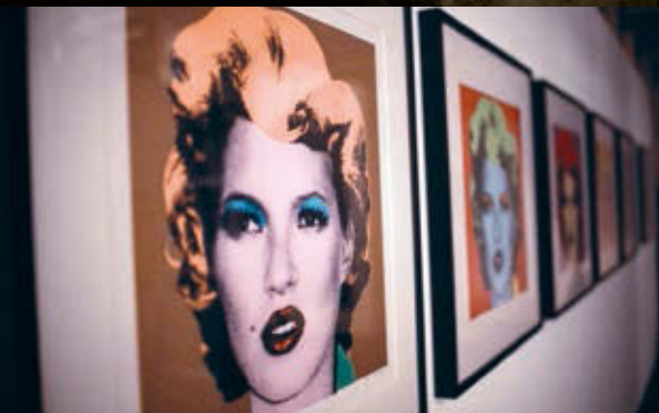
BANKSY: Kate Moss (Eredeti színskála) , 2005, szitanyomat, papír, 71×71 cm HUNGART © 2018

galériáját. Annak ellenére, hogy pártfoglaltjával 2008-ban szétváltak útjaik, 2016 óta London központjában Banksy Print Gallery néven nyomtatott áruló üzletet működtet.