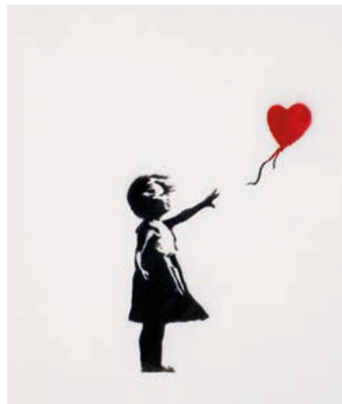
BANKSY: Lány léggömbbel, 2004, szitanyomat, papír, 66x50 cm