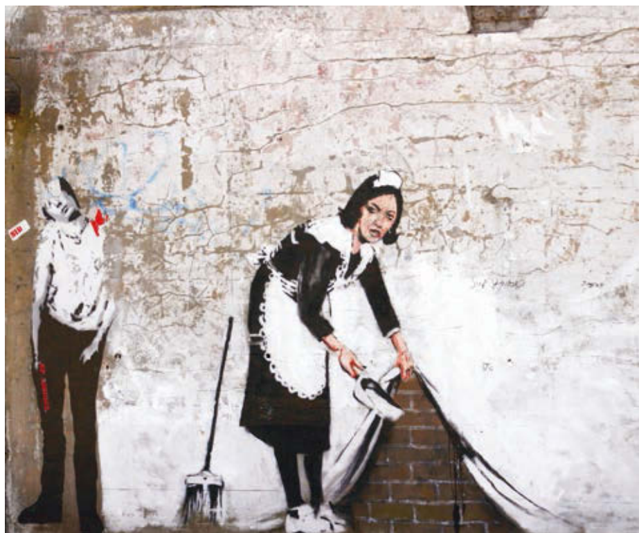
BANKSY: Takarítónő , graffiti, London