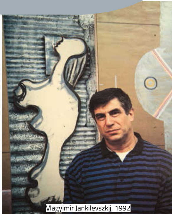
Vlagyimir Jankilevszkij, 1992

Hamarosan ismertté váltak nagy méretű, festett deszkából, farostlemezből, fémről készült, gyakran nyomasztó világot idéző, pszichológizáló, filozófiai hangvételű triptichonjai. A budapesti Ludwig Múzeum is őriz egyet. A konceptuális művészet egyik legkitűnőbb alkotásának tekinthetjük az Ajtó című, 1972–1974-ben készült művét, melyben több fázisban mutatja be egy nyomasztó moszkvai társbérletbe belépő ember alakját. Igazi kopott ajtót, szakadozott tapétát alkalmaz, háttal álló alakját gyűrött ruhába öltözteti, aki jellegzetes orosz szőrme füles sapkát visel, s kezében bevásárló hálót tart. Az utolsó fázisban az alak a szűk előszobából valamiféle végtelenbe lép át, mintegy eltűnik. Az erről készült fotósorozatot a Kovalovszky Márta rendezésében létrejött székesfehérvári, nagyszerű kiállítás is bemutatta 1976-ban. 1