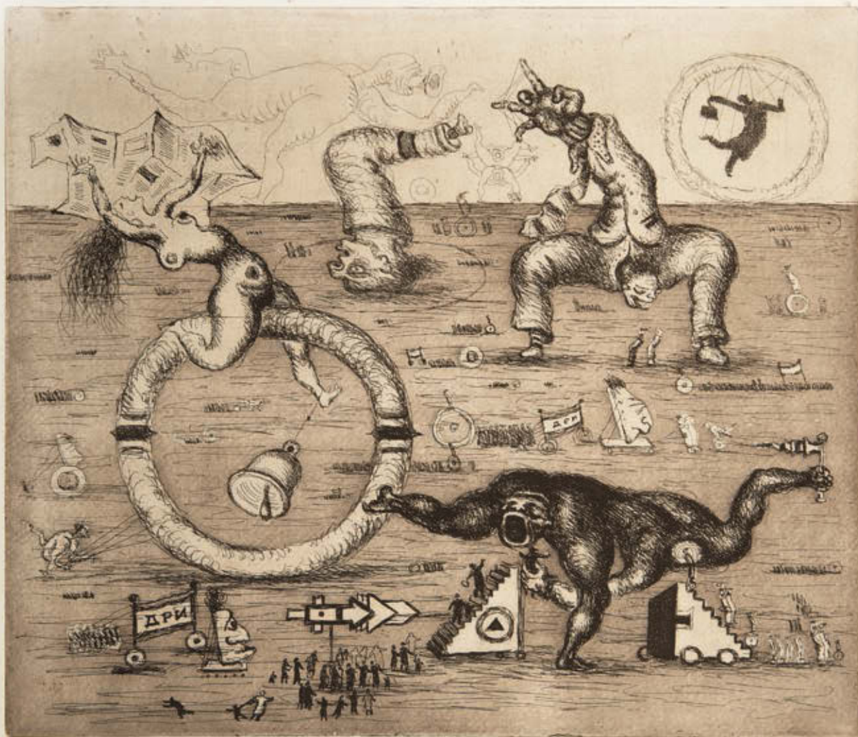
Vlagyimir Jankilevszkij: A mutánsok , a Sodoma és Gomorra-sorozatból, 1978, rézkarc és aquatinta, 29,7x34 cm, HUNGART © 2018

Magyarországra hozni. Az éber vámos azonnal lecsapott rájuk. Kérdésre azt válaszoltam, hogy ezek tapéták. Rendben, mondta, néhány tapétát ki lehet vinni.)