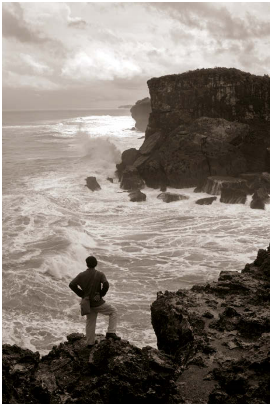
BARTIS ATTILA: Férfi az óceán felett , Krakal, Jáva, 2016, HUNGART © 2018

A szigeteken című kép előtt állva az a benyomásom támad, hogy valamiféle tompán duruzsoló, finom ritmikusság tartja mozgásban a tárlat egészét. Ez a ritmikusság, ütemesség több szinten is értelmezhető, ha a tájképekben bekövetkező változásokra tekintek, akkor nem is ritmikusságot, hanem cirkularitást írnék inkább. A tajtékzó, háborgó tenger és a forró napsütéstől simára olvadó homokos part ellentétpárjának vagy a burjánzó zöld lombok és szikkadt, recsegő faágak kontrasztjának állandó, zakatoló váltakozásában, körforgásában a lét esszenciális dinamikáit vélem felfedezni. A ritmikusság, az egyenletes ütemű mozgás nemcsak tematikusan ragadható meg, hanem a