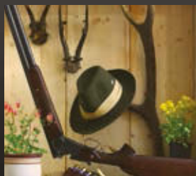
JEAN-BAPTISTE OUDRI EMLÉKÉRE, 2016 digitális fotó (részlet)