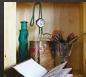
SZEKRÉNYKE KÖNYVVEL, 2015 digitális fotó (részlet)

A HUNGART 2009 óta jelenteti meg kismonográfia-sorozatát, amely kortárs képző-, ipar- és fotóművészek munkásságát dolgozza fel. A HUNGART-könyvsorozat hiánypótló a vizuális művészeti szakmában és a hazai művészeti könyvpiacra.