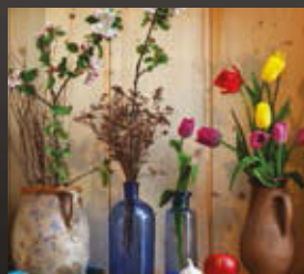
TAVASZ. HOMAGE Á RÖLING, 2016 digitális fotó (részlet)