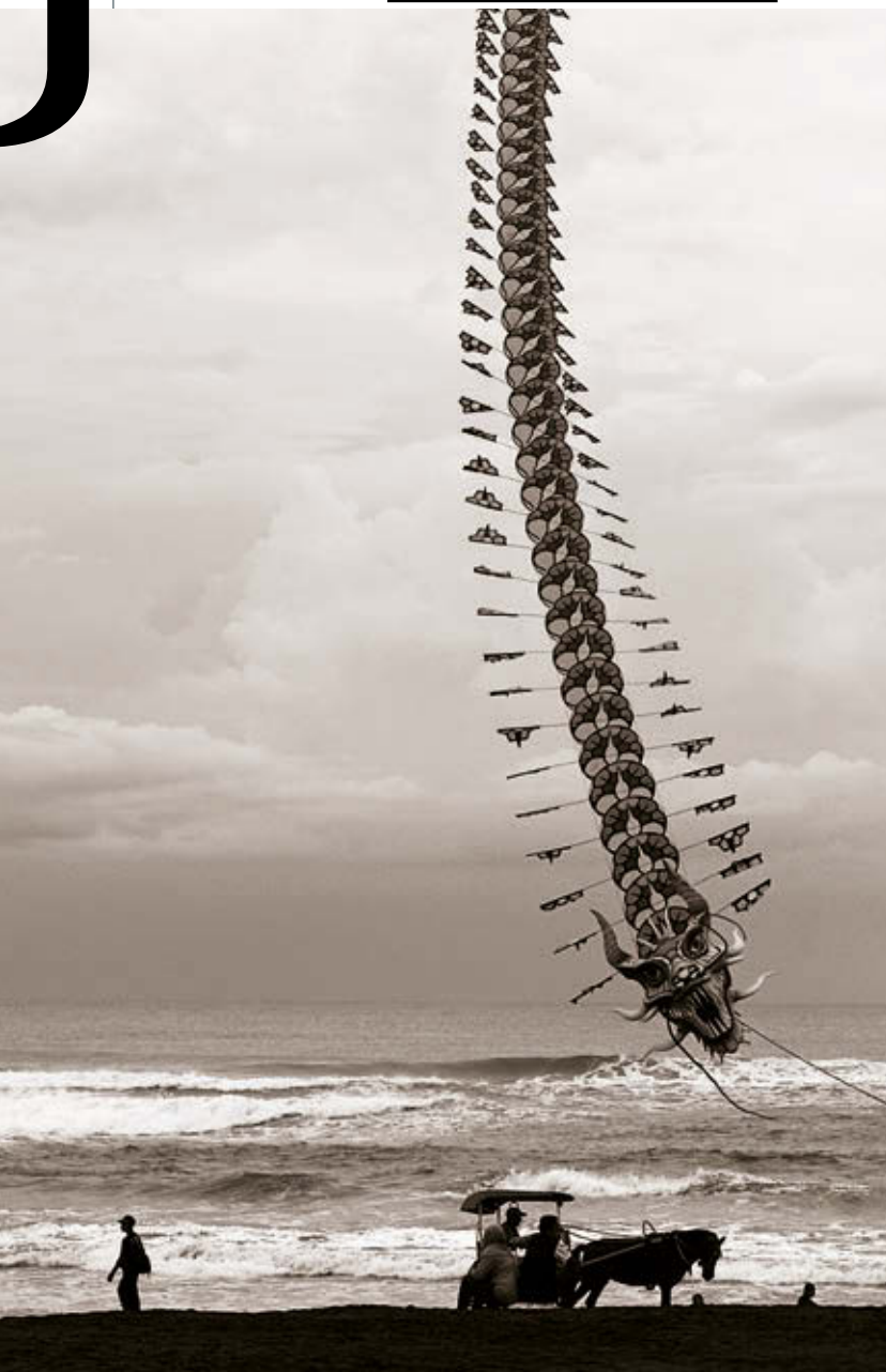
BARTIS ATTILA: Sárkány, Parangtritis, Jáva, 2016 HUNGART © 2018

Bartis Attila a kortárs magyar irodalmi szcéna egyik legkiemelkedőbb alakja, de az talán kevésbé nyilvánvaló az olvasó (és néző) számára, hogy legutóbbi kötete, A vége – ami az elsőtől az utolsó mondatáig egy Budapest-regény – nagyrészt a világ legnépesebb szigetén, az indonéziai Jáván, Yogyakarta városában íródott. Bartis a földrajzilag és kulturálisan is távol eső vidéken töltött szakaszos elvonulásaiban az íráson kívül mással is foglalatoskodik: fotózik. Ezekből, a Jáva szigetén 2014 és 2017 között készült képekből nyílt nemrég kiállítása a Mai Manó Házban.