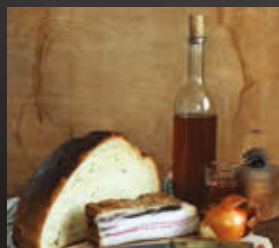
REGGELI, 2013 digitális fotó (részlet)

Alkotások a HUNGART által kiadott Chochol Károly kötetből