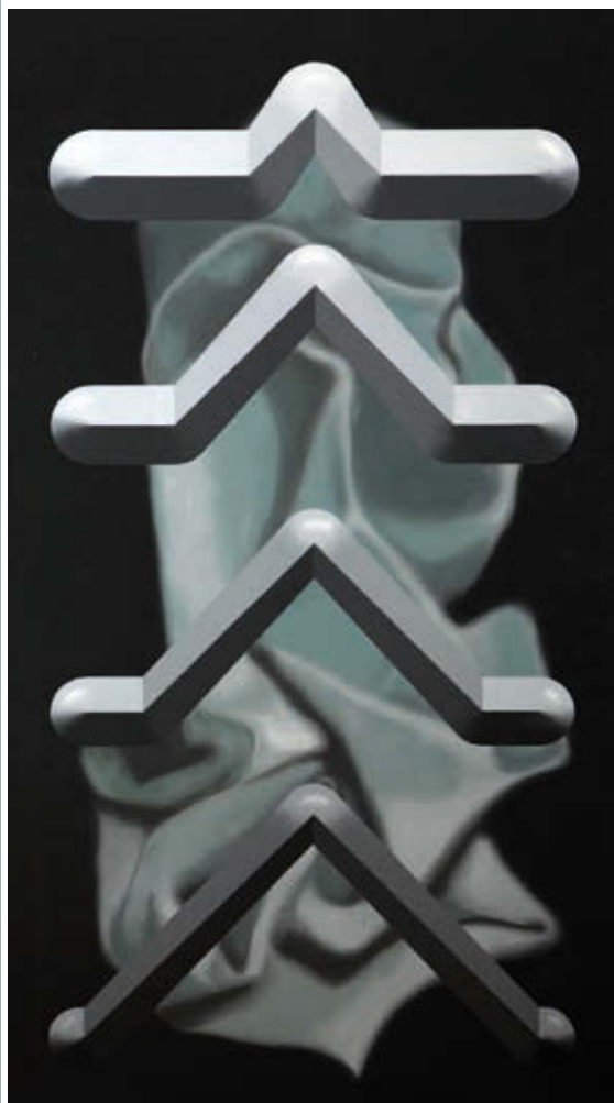
MAGYAR GÁBOR: DCCLXIX, 2002, olaj, vászon, 250×140 cm

Persze vannak oldottabb, kevésbé hieratikus, de enigmatikus mivoltukat nem nélkülöző művei is. Ezekben több őrződött meg a fiatal festő mámoros könnyedségéből s a képességéből, ahogyan be tudta zárni a szinte légnemű, súlytalan fuvallatokat, színpermeteket. Dermesztani most is sikerül