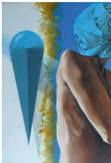
MAGYAR GÁBOR: A szárny, 2010 olaj, farost, 100×70 cm