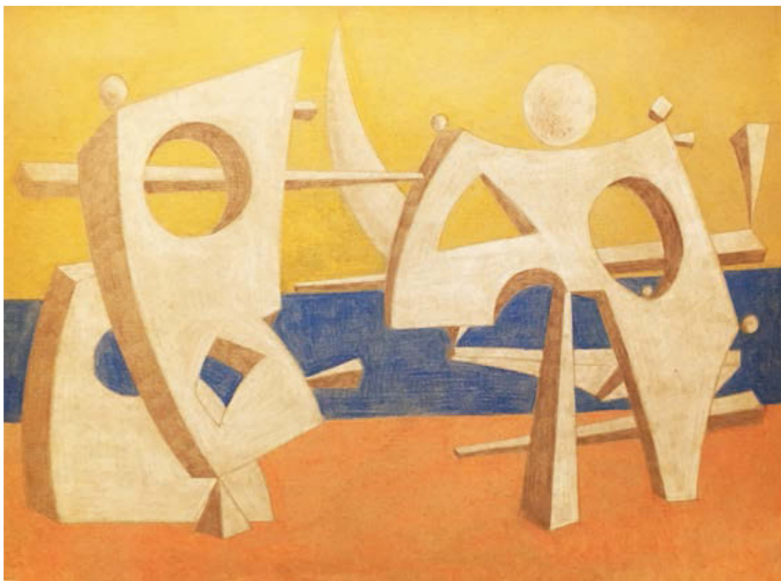
BÖHM LIPÓT: Abstract kompozíció , 1964, ceruza, karton, 70x100 cm, HUNGART © 2018

Mindez természetesen nem azt jelenti, hogy Böhm Lipót számára jelentés vagy tartalom nélküli lett volna a láthatón túli, az absztrakt formák világa. Ellenkezőleg. Egy önmagáról különös módon egyes szám harmadik személyben írt szövegében az Absztrakció fejezetcím alatt így fogalmaz: „A vízfestmények után jönnek az absztrakt művek. Poldi, úgy látszik, ráakad az ő igazi hangjára ezekben, keresvén az ő igazi útját, több évtizede dolgozik