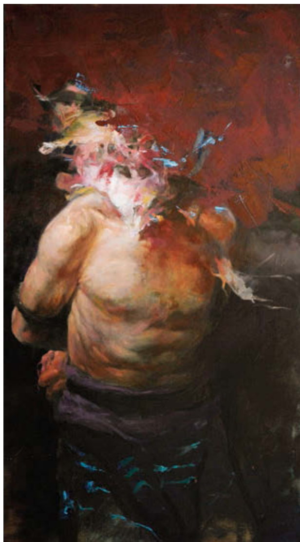
MÁTÉ LÁSZLÓ: Damaged I. , 2016, olaj, vászon, 90x50 cm