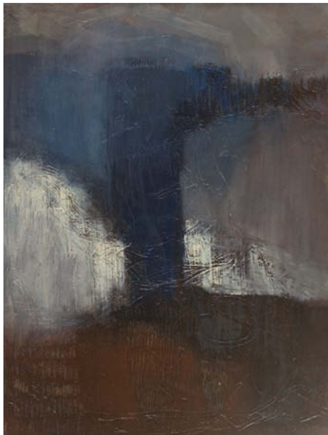
KRISTÓFY DÁNIEL: Tinnitus , 2016, olaj, vászon, 80×60 cm