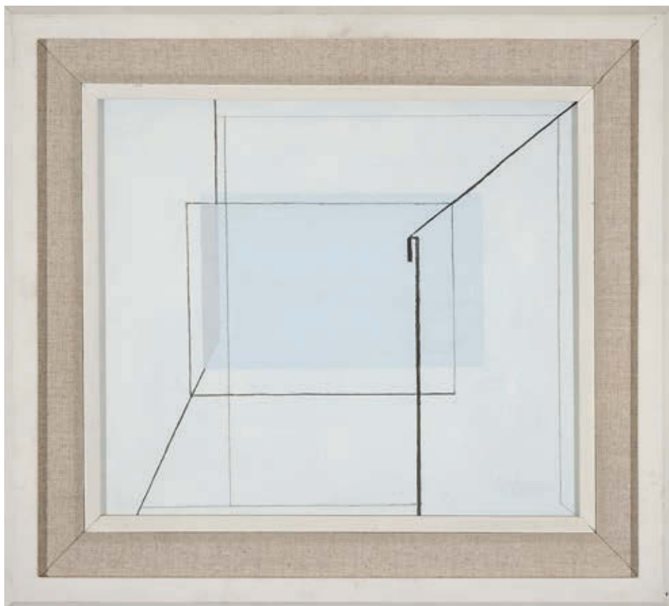
KONOK TAMÁS: Centrikus tér , 1980, akril, vászon, 47×61 cm, HUNGART © 2018