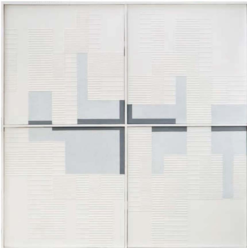
SERÉNYI ZSIGMOND: Terek és struktúrák , é.n., akril, vászon, 80×80 cm, HUNGART © 2018