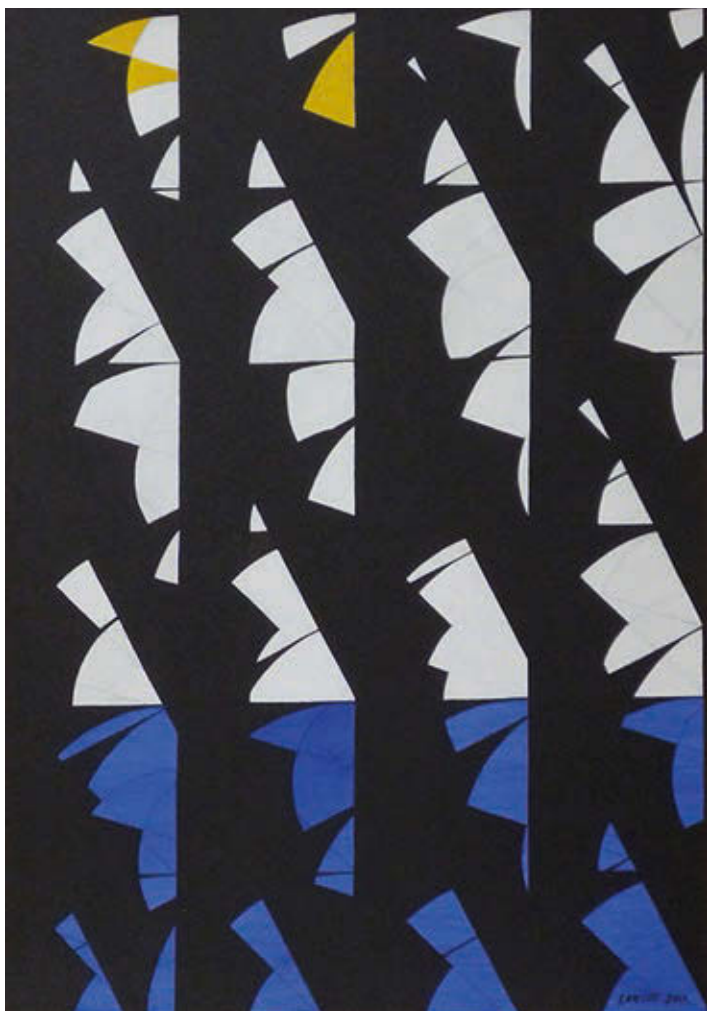
LANTOS FERENC: Requiem , 2011, akril, vászon, 70×102 cm HUNGART © 2018

a szocializmus nagyszerűségét, mint egy szocialista realista stílusban megfestett izzadó kohással. Aki, mint például Gyarmathy Tihamér, kitartott a nonfigurativitás mellett, nem jutott kiállítási lehetőséghez. Hosszú idő kellett ahhoz, hogy kialakítsam a magam rendszerét permutáció által rendszerezett kompozíciókkal létrehozott geometrikus absztrakt művekkel.