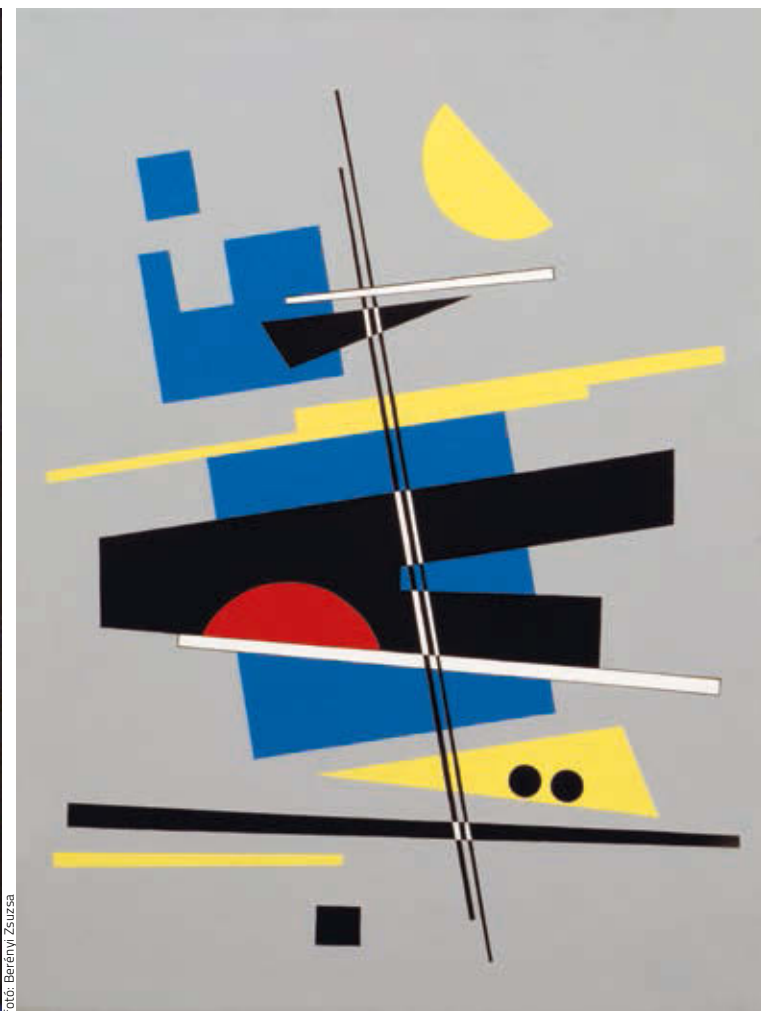
GÁLYÁSZ ANETT: Kompozíció IV. , 2010, olaj, fa, 53×60 cm HUNGART © 2018

N. J.: Eltelt már elég idő ahhoz, hogy lássuk, idős és nagy formátumú művészek milyen hatást gyakoroltak a későbbi generációkra. Egyáltalán nem biztos, hogy ténylegesen azok hatottak, akik az egyetemen oktattak, hiszen az igazán jó tanárok hagyják, hogy a tanítványok megtalálják a saját hangjukat, és nem az a jó tanítvány, aki azt csinálja, amit a mestere. Egymásra hatások, kölcsönzések, azonos nézőpontok, folytatások, kiegészítések – leginkább ezek a kapcsolódási pontok érdekeltek, és az, hogy a fiatalabbak mit tudtak elfogadni egy előtűk járó generációtól. Kerültem a Mester és tanítvány címet, mert itt olyan tanítványok szerepelnek, akik időközben