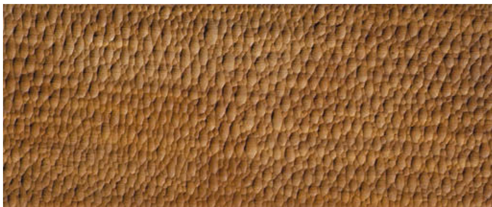
CSIKY TIBOR: Cím nélkül , 1965, mahagóni, 25,5×60,5 cm, HUNGART © 2018

A mostani kiállítás a geometrikus absztrakt irányzathoz kötődik. Miként indult el ebbe az irányba?