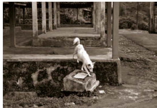
BARTIS ATTILA: Piaci kutya, Kulon Progo, Jáva , 2014

Bartis regényei ( A nyugalom , A vége ) Amerikától Kínáig nemzetközi hírnevet hoztak számára, de írói tevékeny- sége mellett pályáját végigkísérte a fotográfia is. Az utóbbi harminc évben az írás, azaz a gondolat rögzítése és a kép, vagyis a látható pillanat megörö- kítése párhuzamosan, egymást kiegészítve kötötték le a művészi figyelmét. A képek által kiváltott asszociációk, a sorozatok szerkesztésének elvei felis- merhetők prózájában is. Nem véletlen, hogy regényeiben és drámaiban is többször feltűnik a fotográfus alakja, hősei gyakran vesznek kamerát a kezükbe.