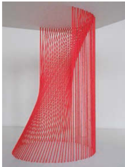
ANTALACI: Térlőtés no. 4 , 2017, akril, vászon, hímzőfonal, ~ 30×30×30 cm

Az audiovizualitás összefüggéseivel foglalkozó Hermina Alkotócsoport zeneszerzői, zenészei, képzőművészei a CentriFUGA-koncertsorozathoz kapcsolódnak Kímélő program című kiállításukkal. A CentriFUGA zeneszerzői közül többen az alkotócsoport tagjai, így ezzel a címmel is szeretnék kifejezni az összetartozást – bár azt nem ígéri meg, hogy minden bemutásra kerülő műalkotásnak köze lesz a mosógéphez. A Kímélő program felüldülést nyújt a tavaszi fáradtságtól szenvedőknek, a stressz miatt elgyötörteknek s azoknak, akik a rengeteg tavaszi esemény, ünnepek és választások miatt azt sem tudják, hova fordítsák a fejüket. Az elmúlt három évben a Hermina Alkotócsoport azon dolgozott, hogy olyan közös műveket hozzon létre, amelyekben a zene és képzőművészet egyaránt szerepet játszik. A kiállításon korábban már bemutatott és új művek egyaránt megtekinthetők, meghallgathatók.