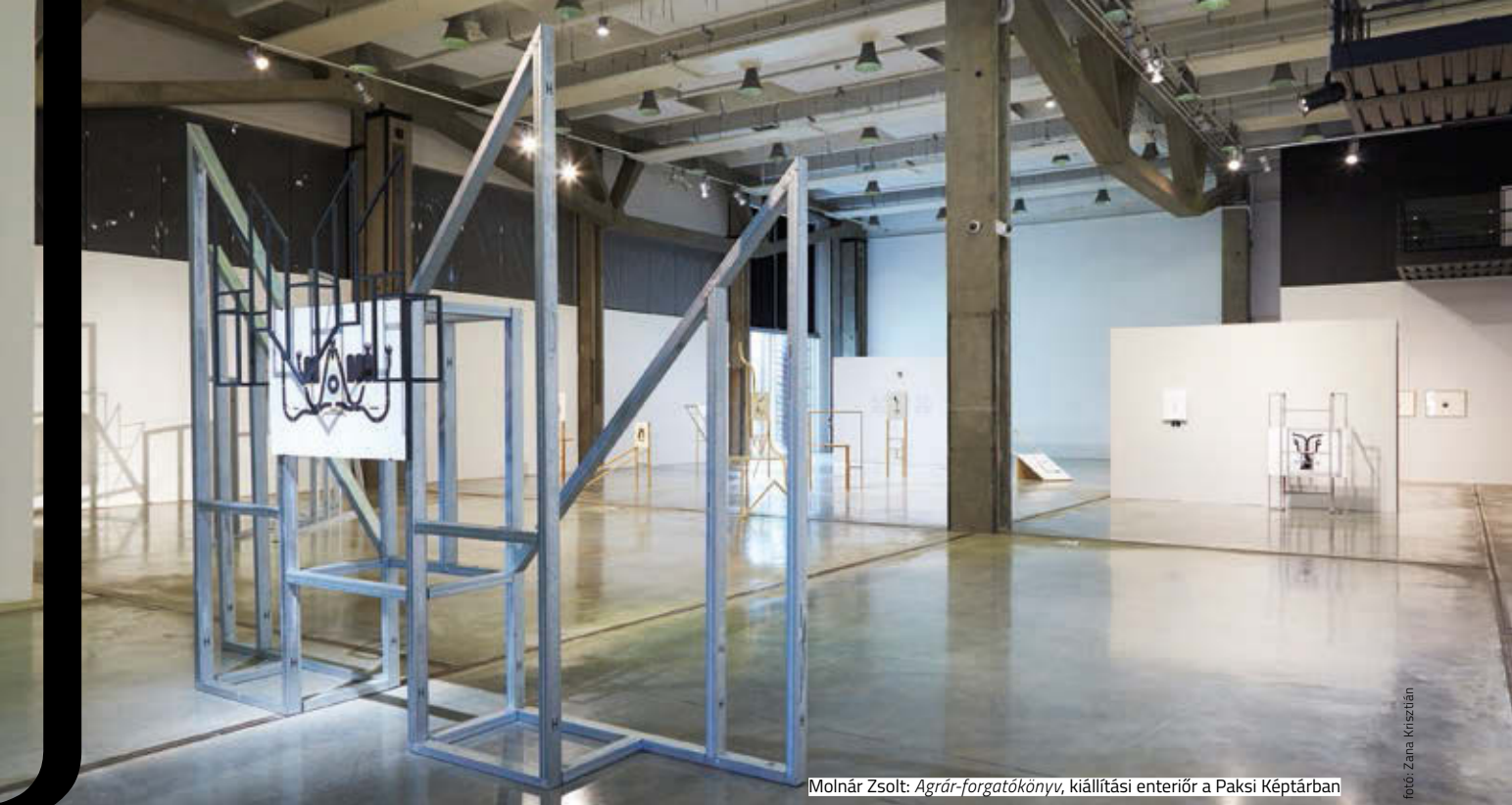
Molnár Zsolt: Agrár-forgatókönyv , kiállítási enteriőr a Paksi Képtárban