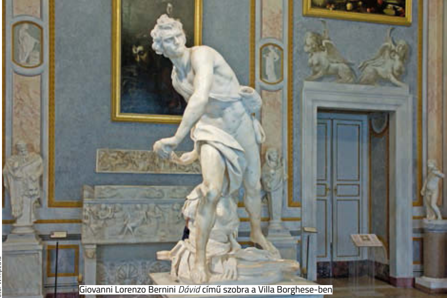
Giovanni Lorenzo Bernini Dávid című szobra a Villa Borghese-ben