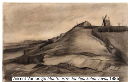
Vincent Van Gogh: Montmartre dombjai kőbányával , 1886

Mindkét újonnan felfedezett kép szerepelni fog hamarosan Larenben a Singer Laren Museum kiállításán.