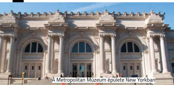
A Metropolitan Múzeum épülete New Yorkban