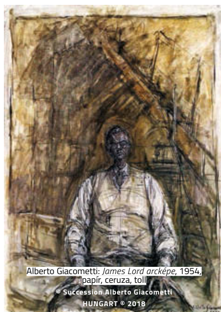
Alberto Giacometti: James Lord arcképe, 1954, papír, ceruza, toll

A Montparnasse-on, Giacometti műtermének helyén idén nyáron nyitja meg kapuit a Giacometti Foundation következő épülete. Az intézet igazgatója elmondta, hogy a tervek szerint nemcsak időszaki kiállításokat terveznek, hanem egy kutatócentrum, valamint az eddig ritkán látott grafikai gyűjtemény is itt kapna helyet.