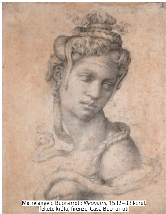
Michelangelo Buonarroti: Kleopátra , 1532–33 körül, fekete kréta, firenze, Casa Buonarroti

Ugyan csak február közepéig látható a Metropolitan Museum of Art Michelangelo: Divine Draftsman and Designer című kiállítása, a több mint félmillió látogatójával így is jó esélye van a 2018-as év leglátogatottabb tárlata cím elnyerésére. Az eddigi legnagyobb Michelangelo-tárlaton a zárásig napi több mint 7000 látogatóra számítanak, a finisszázs előtti hétvégén pedig meghosszabbított, éjszakai nyitva tartással üzemel a múzeum.