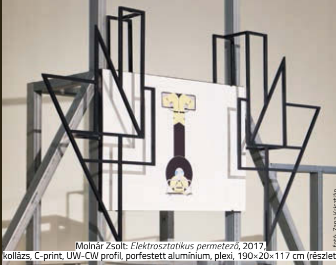
Molnár Zoltán: Elektrosztatikus permetező , 2017, kollázs, C-print, UW-CW profil, porfestett alumínium, plexi, 190x20x117 cm (részlet)