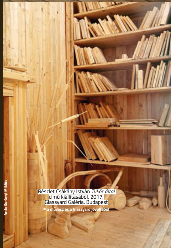
Részlet Csákány István Tükör által című kiállításából, 2017, Glassyard Galéria, Budapest © a művész és a Glassyard Jövőtábor