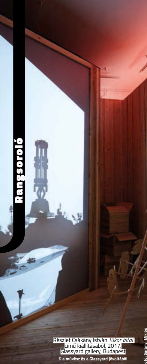
Részlet Csákány István Tükör által című kiállításából, 2017, Glassyard gallery, Budapest © a művész és a Glassyard jövőtárból