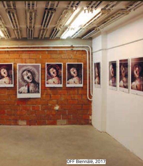
OFF Biennálé, 2017