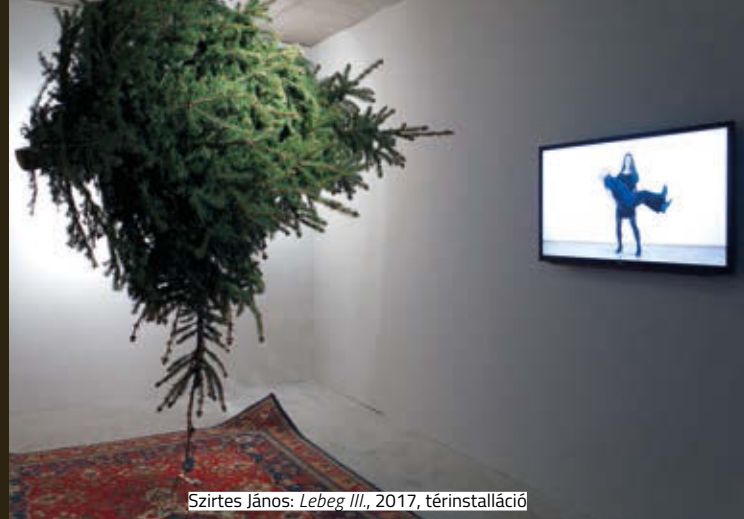
Szirtes János: Lebeg III , 2017, térinstalláció