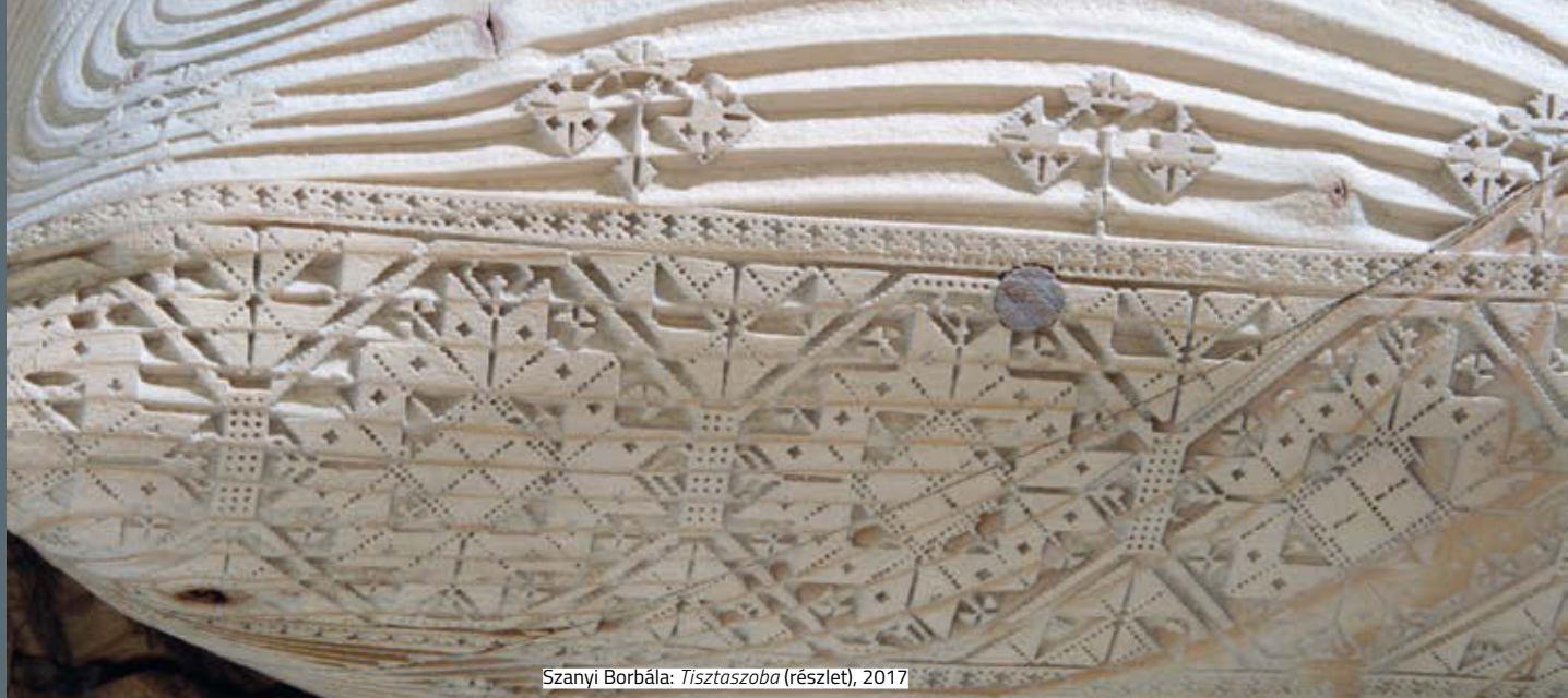
Szanyi Borbála: Tisztaszoba (részlet), 2017