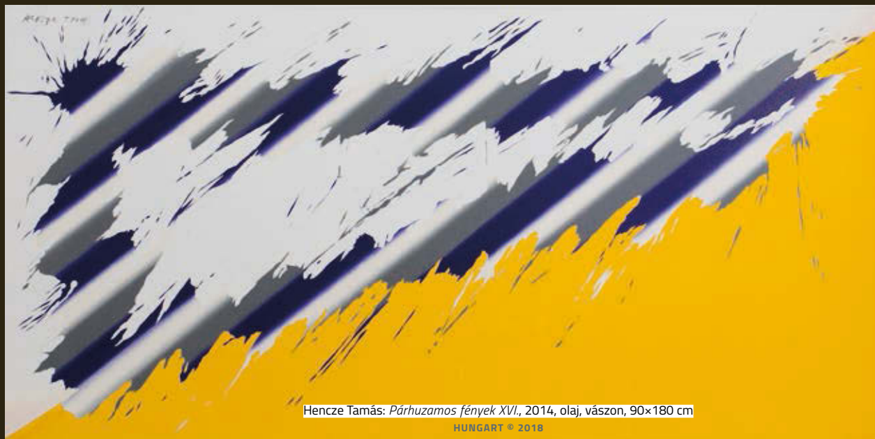
Hencze Tamás: Párhuzamos fények XVI. , 2014, olaj, vászon, 90×180 cm

Szerencsére rossz – számomra élvezhetetlen – kiállítást nem láttam, de problémás, vitára serkentő volta ellenére a Keretek közt. A hatvanas évek művészete című, Nemzeti Galéria-beli kiállítása okozott némi csalódást. Választ vártam néhány koncepcionális kérdésre, ehelyett egymásra alig vetülő múdömpinget találtam, bár sok izgalmas apró részlettel, ötlettel.