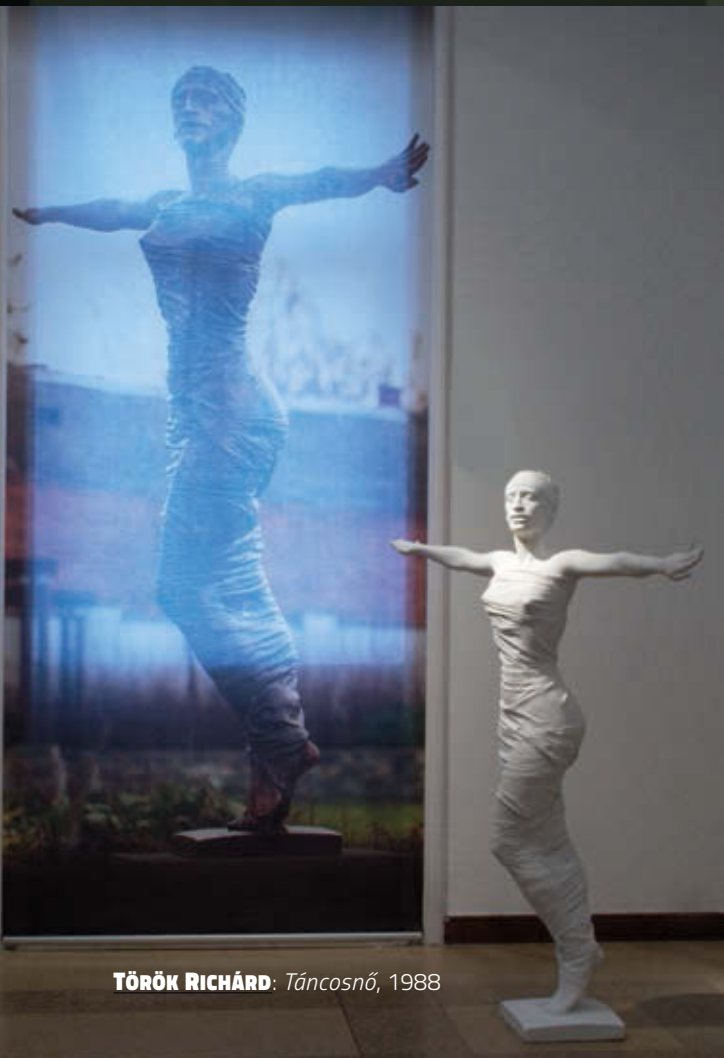
TÖRÖK RICHÁRD: Táncosnő, 1988