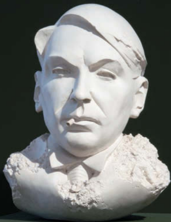
TÖRÖK RICHÁRD: Móra Ferenc mellszobor, 1991