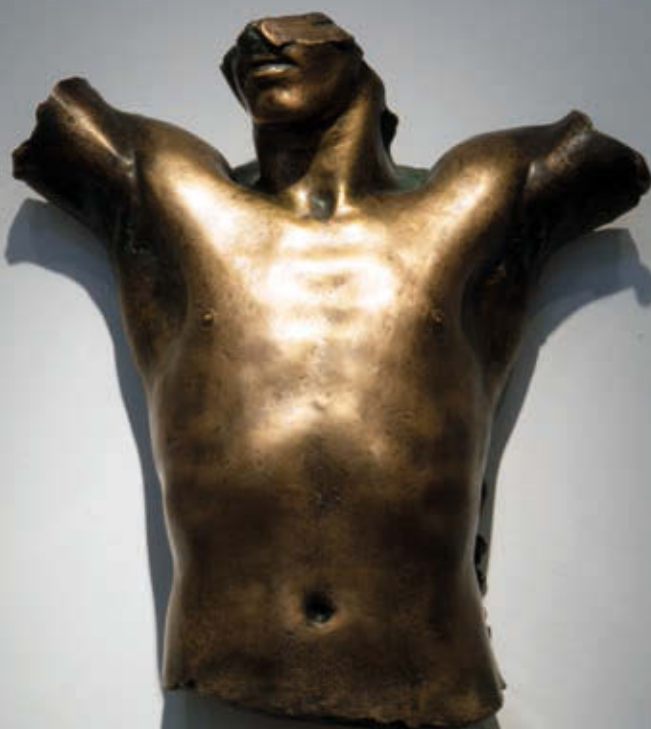
TÖRÖK RICHÁRD: Róma, 1983