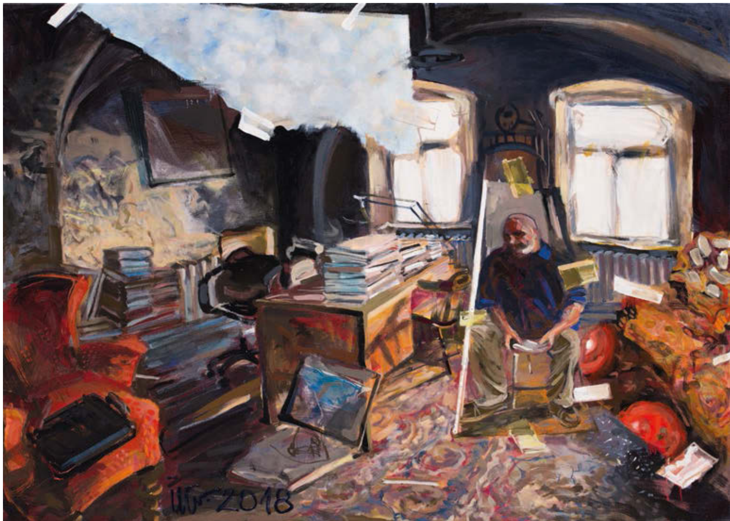
ÚTŐ GUSZTÁV: Nagyenyed , 2017, olaj, vászon, 100×140 cm