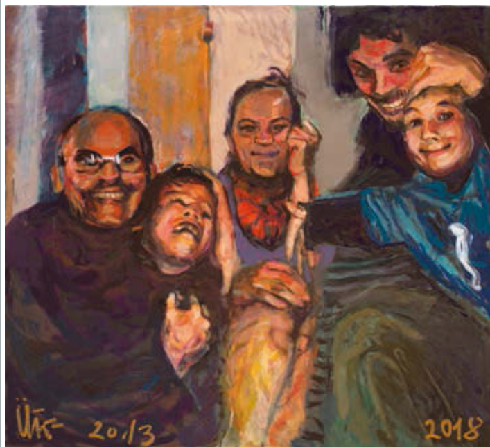
ÚTŐ GUSZTÁV: Ütőék , 2013-18, olaj, vászon, 100×110 cm

folytatva Yves Klein magatartásával. Munkái nem ugrást feltételeznek, hanem a magasba való szárnyalást vetítik előre. Égi jelentés, valaki jelez valakinek valamit, dialógus jön létre, amelyben az ég kék síkja nem az egyedülállébe vetettség szorongását, hanem a párbeszéd, a személyes kapcsolatteremtés lehetőségét, sőt igényét tárja fel.