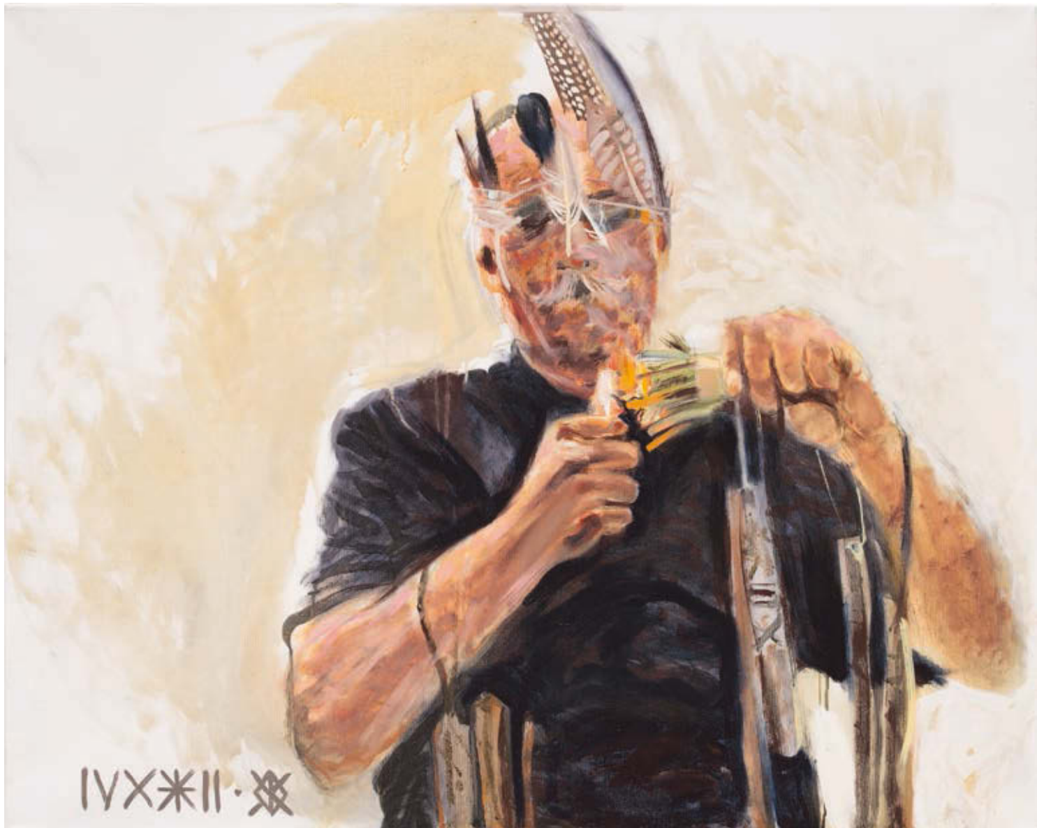
ÚTŐ GUSZTÁV: Lokális vs globális , 2016, olaj, vászon, 80×100 cm

lehetősége végtelen: a gazdaság, politika, hagyomány, vallás vagy szekularizáció témája egyaránt befér. Ezt a szintagmát hallva elsősorban a globális világgazdaság térszerveződésére, a határok elmosódására gondolunk, másrészt pedig arra, hogy a művészet és a kultúra hogyan definiálja magát ebben a közegben. Vannak-e határai, van-e nagyvárosi vagy vidéki jellege, az erdélyi művészet hogyan viszonyul a nemzetihez, egyáltalán: a nemzetközi művészeti szcénához? A posztmodern világszemléletben nem újdonság, hogy a centrum és a periféria viszonya megváltozik, a centrum elveszíti monopol jellegét, és a periféria ezáltal vele egyenrangú helyet kap. Ebben az esetben akár szó szerint is értelmezhető mindez: a Székelyföld mint a magyar periféria, a határország. A festmény terét dominálják, szimbolikus értelmű madártollak, a felfelé szálló füst egy vallásos rítus mozzanatát idézik a néző elé. Így a fogalompár térbeli (földrajzi) vonatkozása az idő és időtlenség, a profán és szakrális kifejezőeszközeivé alakul át.