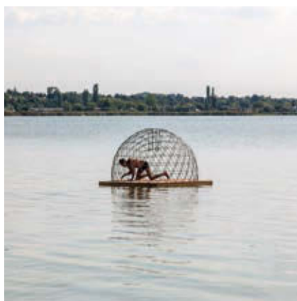
SZIGETI G CSONGOR: Saját csapda 2.0 , Velence, 2016

Az ember csapdába csalja az állatot, az állat csapdába csalja az embert, az ember csapdába csalja a másik embert, illetve saját magát is. Van úgy, hogy önszántából mászik bele, a motivációk nem mindig követhetőek. A ketrecből való szabadulás történhet saját erőből vagy mások segítségével. Szigeti G Csongor projektjében a „humánus” egérfogók, varsák elvén működő térhálós szerkezetek embercsapdák-ként ejtik rabul a térérzékelést. A privát ketrecek hol geometriai alakzatokként, hol antropomorfizált formákként, hol emberi szívet vagy a művész önarcképét mintázva jelennek meg. A művek első alkalommal kerülnek összegyűjtve bemutatásra, kifejezetten az Esernyős Galéria terére tervezett installációban, melynek fontos eleme a fény és az árnyék viszonya, megjelölve a valós és vélt csapdák természetét. Ez a kiállítás csak saját felelősségre látogatható!