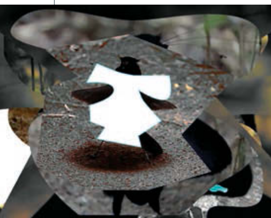
KOMORÓCZY TAMÁS: Divide and quit , 2018, HD videó, 07' 26", videostill

Találkozhatunk-e a semmivel? És ha igen, hol keressük? Talán ott, ahol már nincsenek utak, és még irányok sem, csak a lét esetleges hálózata van, amely most éppen Komoróczy Tamás installációjában bambuszokból szövődik. Ebben a sűrűben pedig a nő nem a tekintet tárgya többé, és a férfi nem a semmi szabadsága, hanem egy kétségbeesett mimikri csupán, amely a pozitívitás látszatát próbálja magára öltetni, hogy láthatóvá váljon, és magára vonja a tekintetét... – de minek is? A rejtőzködő, láthatatlan, semmivé vált nőnek. Így lesz a férfiből pusztá felszín, mely a képernyő keretén túlról sugározza értelmetlen, zajos jeleit, a nőből pedig pusztá mélység, amely üres, néma és valószínűleg ugyanúgy híján van minden értelemnek. Komoróczy Tamás műve a semmi dialektikájának dzsungelébe vezet be minket.