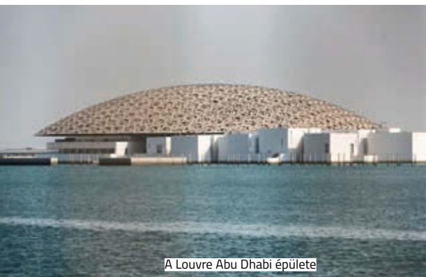
A Louvre Abu Dhabi épülete

jebb kétévi időtartamra – műveket kölcsönöznek majd a múzeumnak. Az első évre tizenhárom francia múzeumtól kaptak műveket, közöttük van Leonardo da Vinci La Belle Ferronniere című festménye a Louvre-ból, Vincent Van Gogh önarcképe a Musée d'Orsay-ból és egy II. Ramszeszt ábrázoló szobor a Louvre-ból.