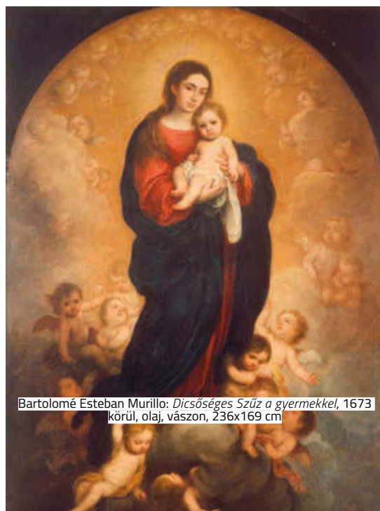
Bartolomé Esteban Murillo: Dicšőséges Szűz a gyermekkel, 1673 körül, olaj, vászon, 236x169 cm