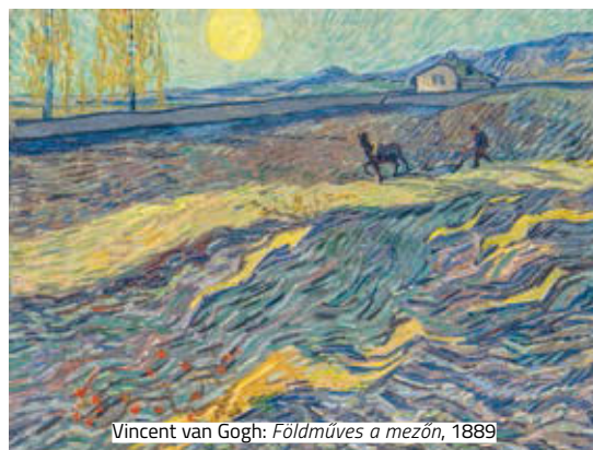
Vincent van Gogh: Földműves a mezőn, 1889

Az impresszionista-modernista kategória győztese Van Gogh 1889-es műve, de a listán megtalálható Klimt Bauerngarten című munkája is, Basquiat műve ( Cím nélkül ) pedig majdnem 50 millió dollárral többért kelt el, mint a kortárs listán másodikként szereplő Andy Warhol Hatvan utolsó vacsorája .