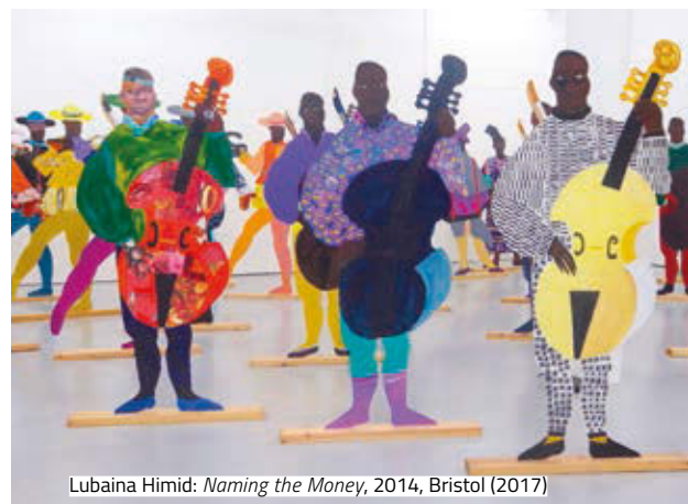
Lubaina Himid: Naming the Money , 2014, Bristol (2017)

A Virtual Reality (VR) a művészet terén is különböző határokat feszeget az elmúlt időben, 2018-ban pedig London megnyitja első szabad és állandó, nyilvános VR-terét. A londoni Zabłudowicz Gyűjtemény 360-nak nevezett programja a filmre, a videóra és a VR-ra fog összpontosítani, és külön helyet nyit a művészeknek, hogy felfedezzék a fejlődő eszközöket.