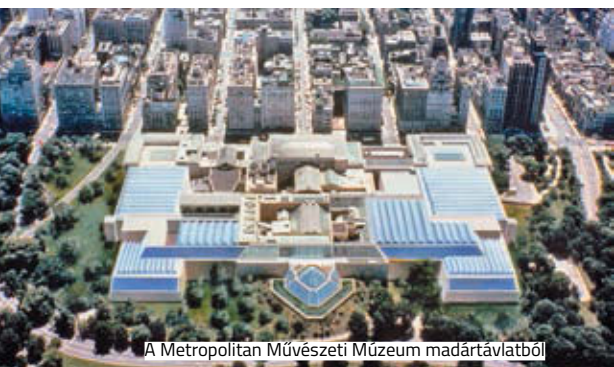
A Metropolitan Művészeti Múzeum madártávlatból