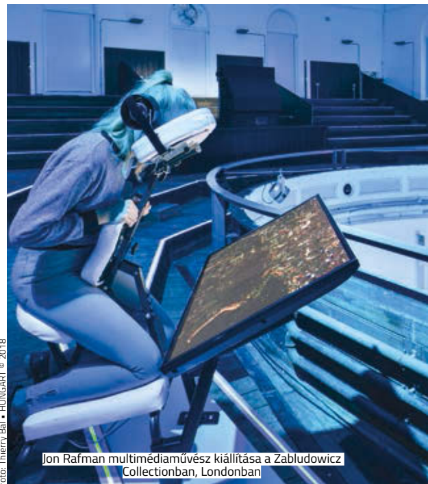
Fotó: Thierry Bal • HUNGART © 2018