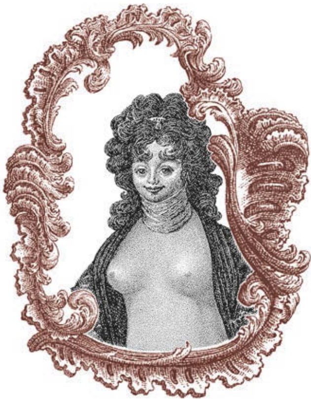
GYULAI LÍVIUSZ: Weöres Sándor: Psyché , 1976, tollrajz