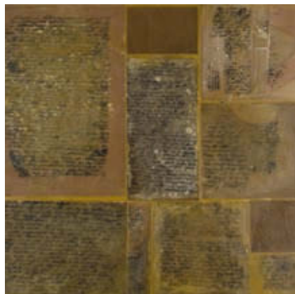
FÁBIÁN NOÉMI: Lenyomat 3 , 2008, farost, méhviasz, paraffin, tus

Fábián Noémi 1968-ban született Egerben, több budapesti kiállítóhelyen volt önálló kiállítása, de kiállított Németországban, Izraelben és Olaszországban is. Többnyire viaszablakra ír, így „hagyja hátra” a „múltból átmentett”, olvashatatlaná tett – szent szövegeket, naplóbejegyzéseket, fohászként is felfogható – üzeneteket, gondolatokat.