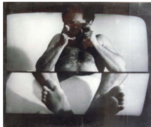
HALÁSZ KÁROLY: Privát adás 2 , 1974

A mostani kiállítást korábban a Ludwig Múzeumban (2017. IV. 14. – VI. 25.) és a pécsi m21 Galériában (2017. IX. 29. – X. 31.) láthatta a közönség.