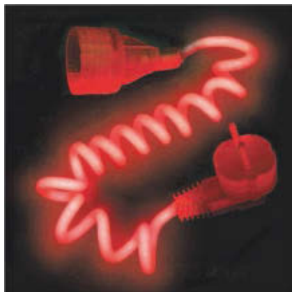
HÉRICS NÁNDOR: Elektromos aura , 2016, 90×120×20 cm, plexi, flexibilis neon

Visszatekintő, retrospektív tárlattal idézi fel a múltat a pop art egyéni hangvétellé hazai képviselője, Hérics Nándor, aki a plakát elkötelezett alkotójaként a 70-es évek végén tervezőgrafikusként indult. Első munkáiban, a beat-pop zenekaroknak készített alkotásaiban világossá vált, hogy Hérics ugyan pop art művész, de nem kötődik az amerikai warholos felfogáshoz, kifejezéseiben sokkal inkább a vasfüggönyön inneni szocreál identitás ellenpontozója. Számos rajzában jelenik meg a vonal mint képzeletbeli neonsövek izzó kaval-kádjá, amiben megkopott emberek szürke történeteit meséli el. Különösen igaz ez a 45 éves alkotópályá alternatív- és punkzenei plakátjaira. A kiállításon az életműből 195 falragaszt tár a közönség elé. A másik fontos szakasza pályájának szintén a neonreklámok világából táplálkozik. Külön emeleten mutatja be szobrai, objektjeit, valóságos neonsövekkel társítva, a 80-as években emblematicusá vált alkotásaitól kezdve a napjainkban készületekkel.