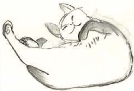
AGNES VON URAY: Macska , 2015, pasztel, papír

A Szépfalvi Ágnesként ismert, jelentékeny pályát befutott festő tabularasára törekedett a mindennapjaiban és a műtermében is. Munkái azokról a művészi lehetőségekről szólnak, amelyeket az utóbbi években végigpróbált a lehetséges és számára leginkább megfelelő utat keresve. Dolgozott fémmel, és konceptuális lightboxokat is készített, melyeken a tőmondatszerű szöveg és a fény együttese a döntő. Önterápiaként lényegre törő, formailag változatos sorozatot rajzolt-festett a mindig a közelében látott macskáról, és ugyanígy: felvállalva a provokatív közhelyszerűséget, bala-toni tájakat örökített meg Földváron. Táblaképfestészetét is ebbe az irányba kormányozta: a tudatosan alkalmazott „bad painting” eklektikus, következtelen, festői szempontból képtelen, hibás, rontott eszközeit gátlások nélkül használta fel bizarr – és a legkevésbé sem „gyűjtőbarát” – női és férfi aktbrázolásain. Kiállítása meglepő és őszinte önreflektív gesztus: arról szól, hogy mit gondol Agnes von Uray a mai festészetéről, a művészi pályáról és az élet művészeténél fontosabb oldaláról.