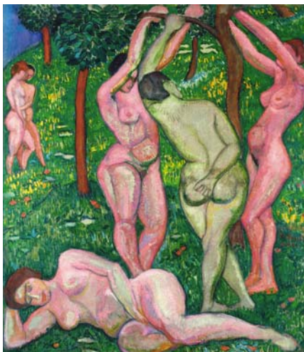
PERLROTT-CSABA VILMOS: Aktok szabadban , 1907–1909, olaj, vászon, 114×92 cm Magántulajdon, HUNGART © 2017

Nagyon izgalmas a szoboranyag, számomra felfedezészámba menő nevekkel, mint például Huszár Imréné. A szobrok honnan érkeztek, hiszen a hazai műkereskedelemnek a szobra-szat nem túl erős területe?