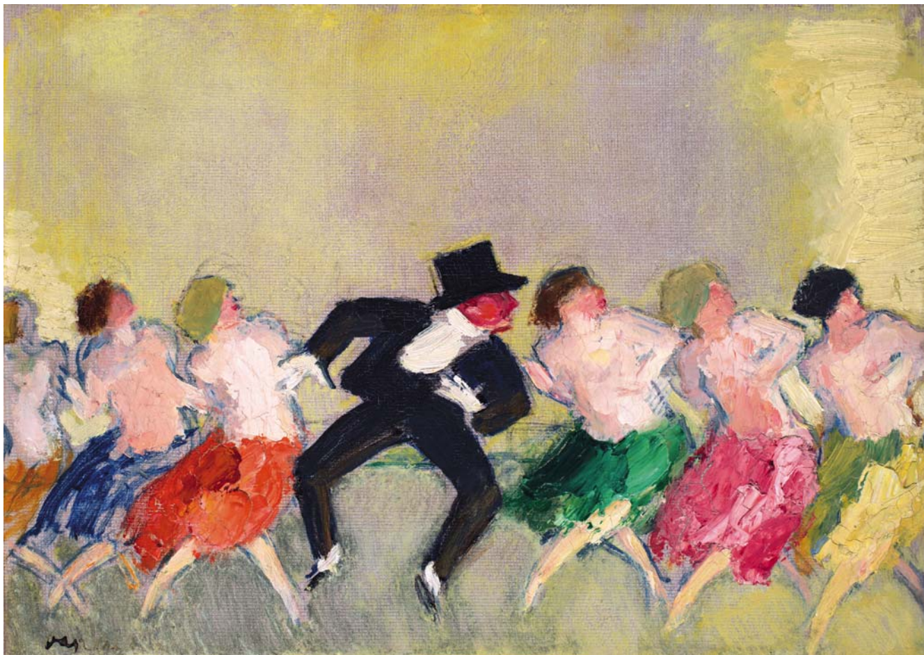
VASZARY JÁNOS: Párizsi mulató (Mistinguett) , 1925, olaj, papírlemez, 32,5×50,5 cm Magántulajdon

menyire komolyan vesszük ezt a munkát. Szándékosan olyan képeket igyekeztünk kölcsönkérni, amelyek nem az állandó kiállításokon vannak, hanem raktárban. De a képek zömében magángyűjteményekből érkeztek, 80–20 százalék az arány. Intenzív kutatási szakasz és hosszú brainstormingok eredménye a galériában látható, több mint 170 művet felvonultató tárlat. Iskolánként, izmusonként mutatjuk be az alkotásokat, kontextusba helyezve. Szeredi Merse Pál kurátor ötlete volt az ernyős szerkezet, hogy jelöljünk ki nagy témákat, és az alá soroljunk be kisebb alfejezeteket, ez lett aztán a katalógus struktúrája is.