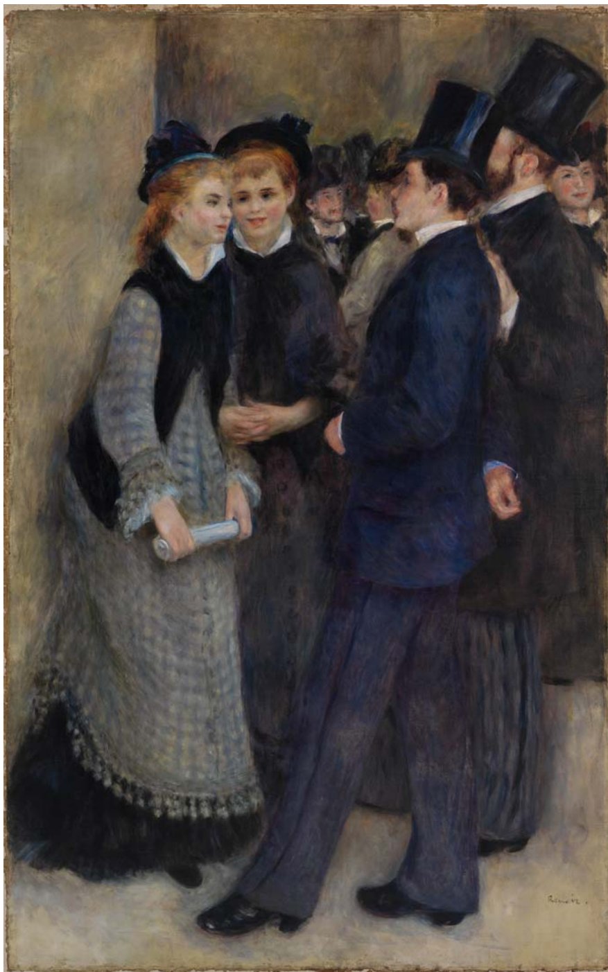
PIERRE-AUGUSTE RENOIR: La Sortie du Conservatoire , 1877, olaj, vászon, 187,3×117,5 cm Barnes Foundation, Merion (Egykor báró Hatvány Ferenc gyűjteményében)

ami befolyásolta az ízlésváltozást, nem más, mint a műkereskedők érdeke. Hangsúlyozom, hogy ebben semmi pejoratív nincs: ők vadásznak az újra, éhesek és mozgékonyak, természetes, hogy ők lelnek rá a legfrissebb értékekre.