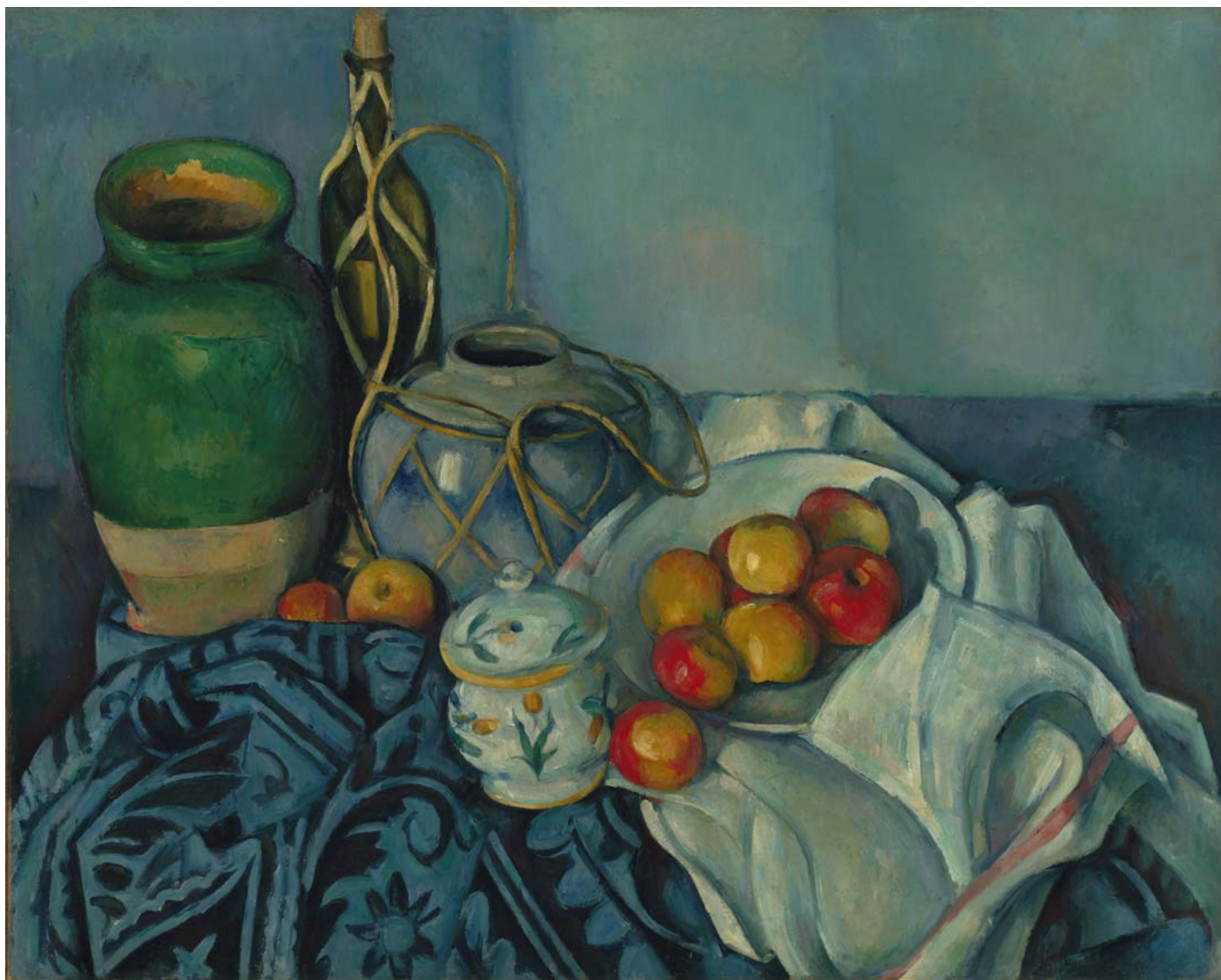
PAUL CÉZANNE: Csendélet almákkal , 1893–94, olaj, vászon, 65,5×81,5 cm J. Paul Getty Museum, Los Angeles (Egykor báró Hatvany Ferenc gyűjteményében)

évek közepén az ő házában, a híres Fő utcai palota egyik reprezentatív lakásában lakott, azon a szimbolikus helyszínen, ahol a születési arisztokrácia és a pénzarisztokrácia szerepet váltott. Ezzel a színopszissal pályáztunk aztán.