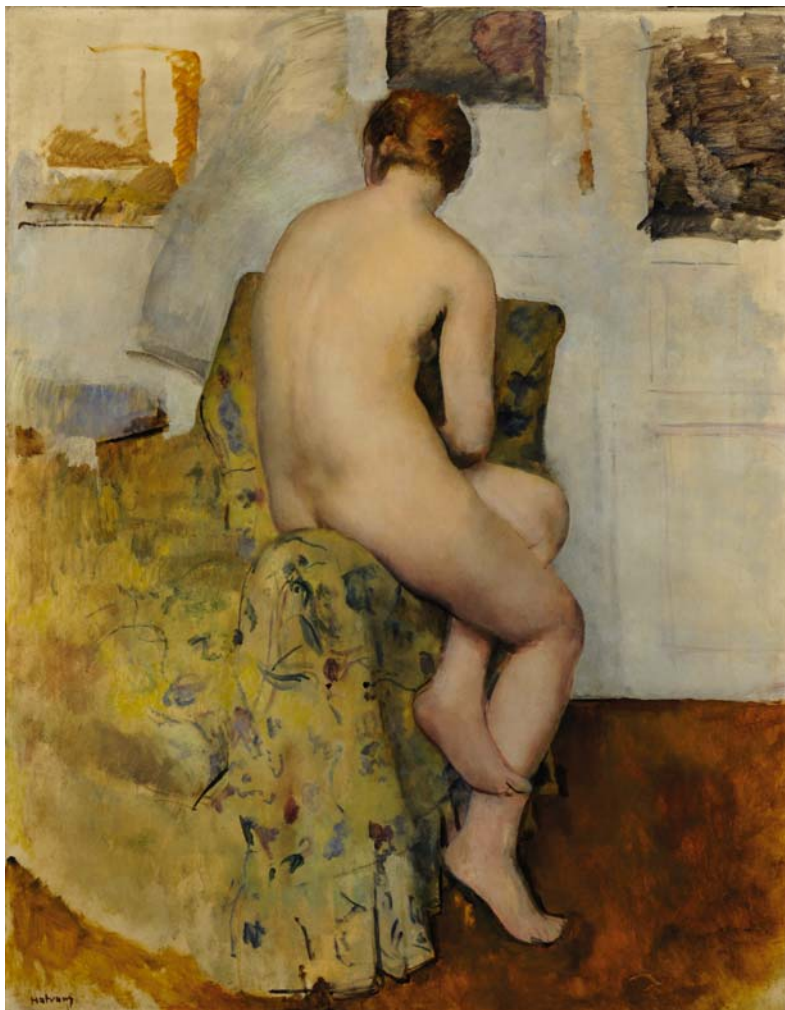
HATVANY FERENC: Fotel karfáján ülő akt , 1910 körül, olaj, vászon, 145,5×114 cm Szépművészeti Múzeum – Magyar Nemzeti Galéria, Budapest

M. P.: Kikiáltották a Tanácsköztársaságot, és másnap elindultak foglalni. Persze előtte már érlelődtek a dolgok, egy korabeli napilap meg is írta, hogy a listákat részben előre összeállították – épp azok a szakemberek, akik korábban dolgoztak ezeknek a gyűjtőknek. Hozzáteszem,