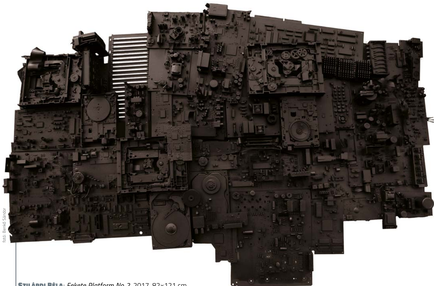
SZILÁRDI BÉLA: Fekete Platform No 2 , 2017, 82×121 cm

be a kvantummechanika; a legújabb gépek tervezői kvantumalapú szerkezetekkel kísérleteznek. Természetesen rengeteg az akadály (például dekoherencia), ám a jövő informatikája nagy valószínűséggel a kvantumszámítógépekre fog épülni.