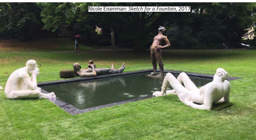
Nicole Eisenman: Sketch for a Fountain , 2017

A Pinault Collection 2018-as tervei között szerepel, hogy önálló kiállítást nyitnak Albert Oehlennek a Palazzo Grassiban, míg egy másik, a Dancing with Myself című tárlatuk ezzel párhuzamosan nyílik majd meg a Punta della Doganában. Oehlen kiállításán 85 művet állítanak ki, ezzel ez lesz a művész legnagyobb volumenű egyéni kiállítása. A Dancing with Myself című tárlaton a művészek – többek között Cindy Sherman, Rudolf Stingel és LaToya Ruby Frazier – önmagukat színészként mutatják majd be.