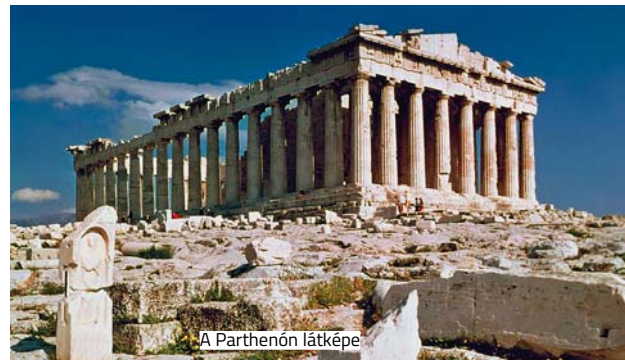
A Parthenón látképe