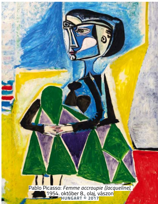
Pablo Picasso: Femme accroupie (Jacqueline), 1954. október 8., olaj, vászon