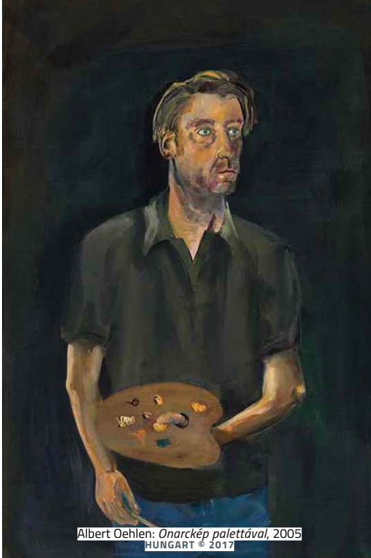
Albert Oehlen: Onarckép palettával, 2005

Még több hét van novemberig, azonban az egyik legnagyobb brit aukciósház, a Christie's már most bejelentette, hogy a következő aukción Picasso 1954-es, Femme accroupie (Jacqueline) című festményét fogják kalapács alá bocsátani. A Jacqueline Roque-ról készült portré még soha nem vett részt átverésen, eddig egy magángyűjtemény része volt, így nyilvánosan is nagyon ritkán lehetett látni. A várható ára 20 és 30 millió dollár között lesz.