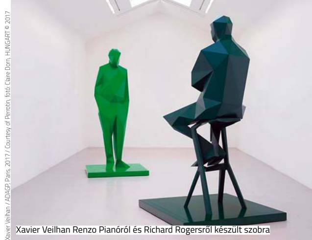
Xavier Veilhan / ADAGP Paris, 2017 / Courtesy of Perrotin, fotó: Claire Dorn, HUNGART © 2017

© 2016 Studio KO, Fondation Pierre Bergé – Yves Saint Laurent