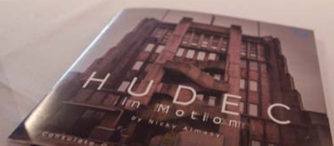
Kötetbemutató Magyarország Sanghaji Főkonzulátusán