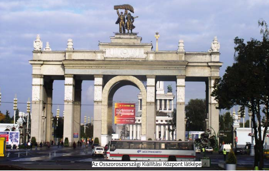
Az Összoroszországi Kiállítási Központ látképe