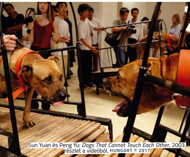
Sun Yuan és Peng Yu: Dogs That Cannot Touch Each Other , 2003, részlet a videóból, HUNGART © 2017

Görögország, kihasználva a Brexitet, újra elővette az Elgin-márványok ügyét. Azzal érvelnek, hogy a szobrok visszaadása nagyban segítené a jó kapcsolat megmaradását az EU és Nagy-Britannia között az esetleges kilépés után. Az Európai Unió pillanatnyi álláspontja viszont az, hogy a márványok ügye már jóval az Unió létrejötte előtt kezdődött, ezért nem kívánnak állást foglalni az ügyben.