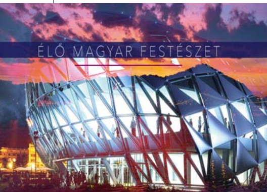
Az esemény plakátja

Három generáció kiállítása a Bálna Budapestben Élő magyar festészet címmel, a kortárs magyar üvegfestészet és a németországi Murnau művészeinek bemutatkozása, galériséták és műterem-látogatás Újbudán, festészeti kerekasztal, minikepek-képpárok, a „női vonal” kiállítás és szimpózium, magyar tudósportrék kortárs festők ecsetjével, a Képzőművészet Ünnepe Szolnokon és több tucat tárlat az ország minden tájáról segít abban, hogy azt, amit mai magyar festészetnek nevezünk, elhelyezhessük Európa és a világ képzőművészeti térképén.