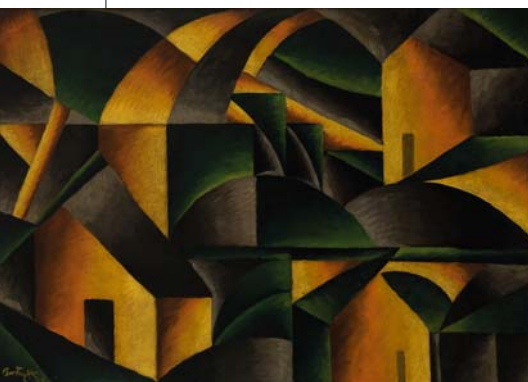
BORTNYIK SÁNDOR: Sárga-zöld tájkép , 1919, a Janus Pannonius Múzeum (Pécs) tulajdona

A magyar festészet egyik jelentős korszakát bemutató reprezentatív tárlat nemcsak a Nyolcak-művészcsoport műveit mutatja be, de az Aktivisták és a Ma folyóirat körének azon alkotóit is megismerheti a közönség, akikhez a Nyolcak több művésze is kapcsolódott. A nagyszabású rendezvény a Külgazdasági és Külügyminisztérium – Balassi Intézet, a Varsói Magyar Kulturális Intézet, a pécsi Janus Pannonius Múzeum és a Szépművészeti Múzeum – Magyar Nemzeti Galéria együttműködésével, a Varsói Királyi Vár Múzeum aktív közreműködésével valósul meg. A tárlat a 2010-es pécsi Európa Kulturális Fővárosrendezvénysorozaton már kimagasló sikert aratott: a baranyai tárlat után több tízezer látta a műveket Budapesten a Szépművészeti Múzeumban, Bécsben a Kunstforumban, majd 2014-ben Párizsban, a Musée d'Orsayban.