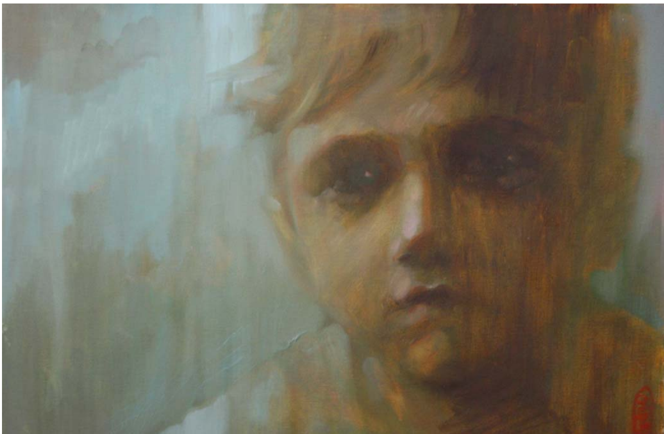
SZENTE-SZABÓ ÁKOS: Várakozó , 2015, olaj, vászon, 40x60 cm Lácacsékei Művésztelep