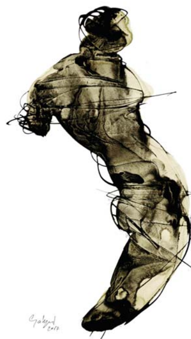
GÁSPÁR GYULA: Talált szobor , 2017, bor, tus, papír, 35×25 cm Lácaicsékei Művésztelep