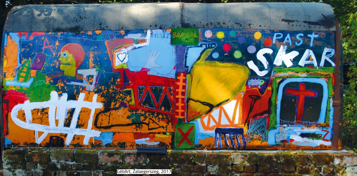
GébArt, Zalaegerszeg, 2017