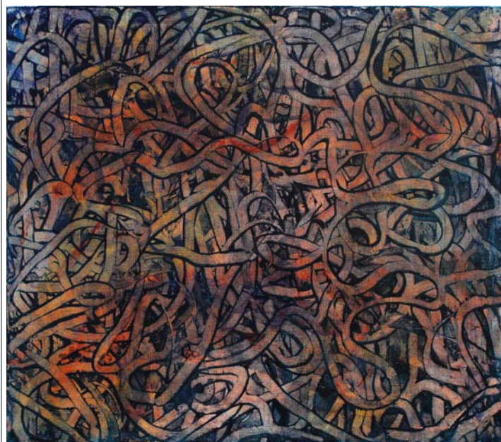
NAGY ZSOMBOR: Cím nélkül I., 2017, olaj, vászon