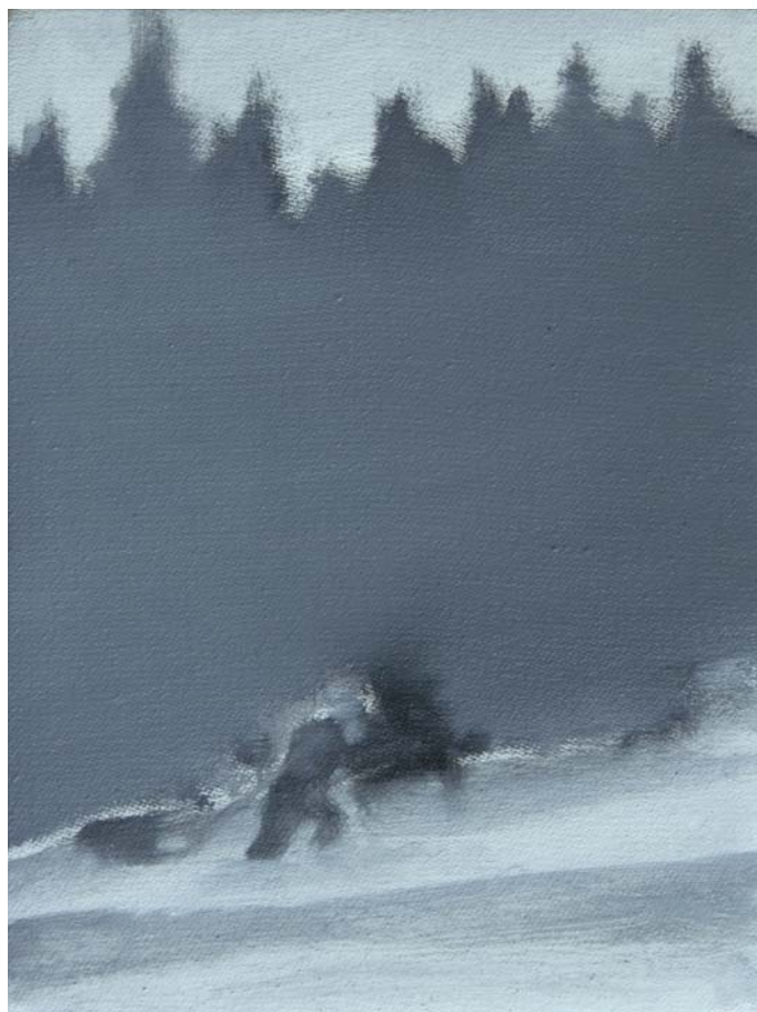
VARGA ÁDÁM: Játék , 2016, olaj, vászon, 15×20 cm