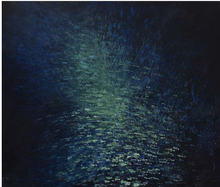
BORUZS ÁDÁM: Szinkronizált súrlódások , 2016, olaj, vászon, 200×170 cm

Nézzünk magunkba: belső felhő mosolyog vissza. És egy kiállítás (befelé) nyílik!