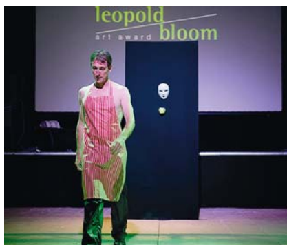
Leopold Bloom-díj, 2017