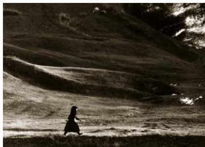
KORNISS PÉTER: Siető asszony, 1973

A tárlat első egysége a 60-as, 70-es években készült, a hagyományos paraszti világot ábrázoló alkotásait mutatja be. Az 1970-es évektől a művész érdeklődése az ingázó munkások felé fordult: A vendégmunkás című sorozatot a második szekcióban láthatjuk. A kiállítás harmadik egysége a globalizáció megjelenésének idejét járja körül, majd a negyedik Kornissnak a 2000-es években készült munkáit mutatja be, ekkor készült a Betlehemesek című sorozata, amelyben először jelent meg az ún. megrendezett kép, a staged photography stílusában létrehozott képtípus. A kiállítás utolsó szekciója a Budapesten munkát vállaló erdélyi asszonyokkal foglalkozik. Ez a sorozat az elmúlt három évben készült, és a Magyar Nemzeti Galéria kiállításán látható első alkalommal.