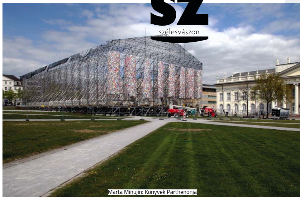
Marta Minujin: Könyvek Parthenonja

Marta Minujin dél-amerikai pop-art művész a 14. documentán több tízezer lehetséges betiltott könyv közül végül 170 műből építette meg a The Parthenon of Books azaz a Könyvek Parthenonja című installációt. A Kassel egyik főterén látható installációt ugyanazon a helyen építették fel valós méretben, ahol 1933-ban marxista és zsidó szerzők könyveit égették el. A 74 éves művész ezzel a látványos alkotással kíván tiltakozni a cenzúra minden fajtája ellen.