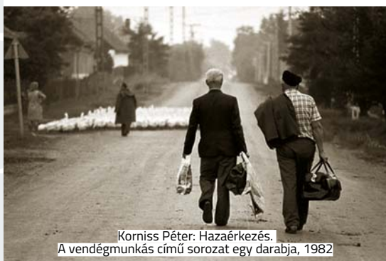
Korniss Péter: Hazaérkezés. A vendégmunkás című sorozat egy darabja, 1982