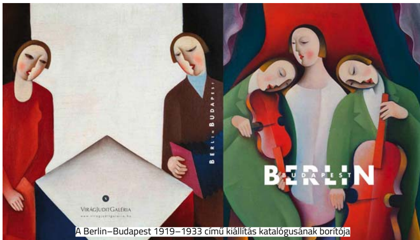
A Berlin-Budapest 1919-1933 című kiállítás katalógusának borítója