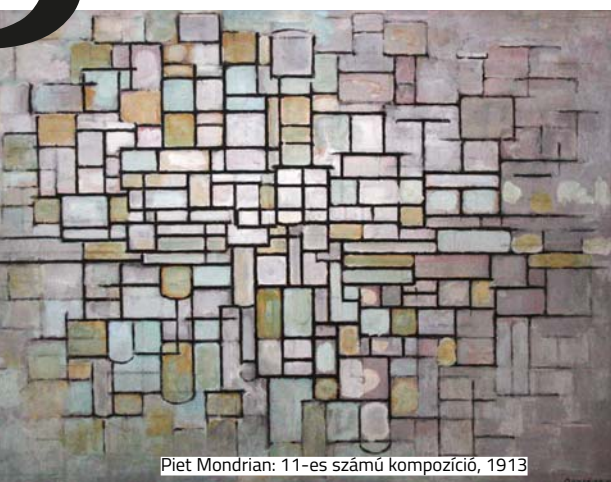
Piet Mondrian: 11-es számú kompozíció, 1913