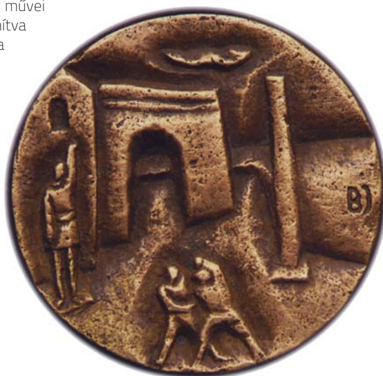
BÁNYAI JÓZSEF: Emlék, 1965, bronz, 42 mm HUNGART © 2017

Alkotói éveit során köztéri szobrokat, kisplasztikákat és érmeket is készített, változó méreteken és különböző