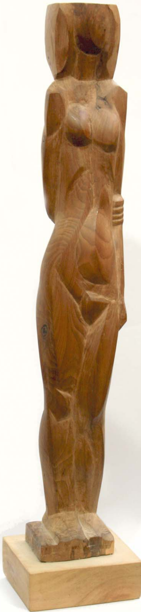
BÁNYAI JÓZSEF: Női akt, 1966 körül, fa, kb. 40 cm HUNGART © 2017