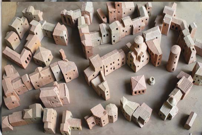
Részletek BÁNYAI JÓZSEF műterméből, 2015