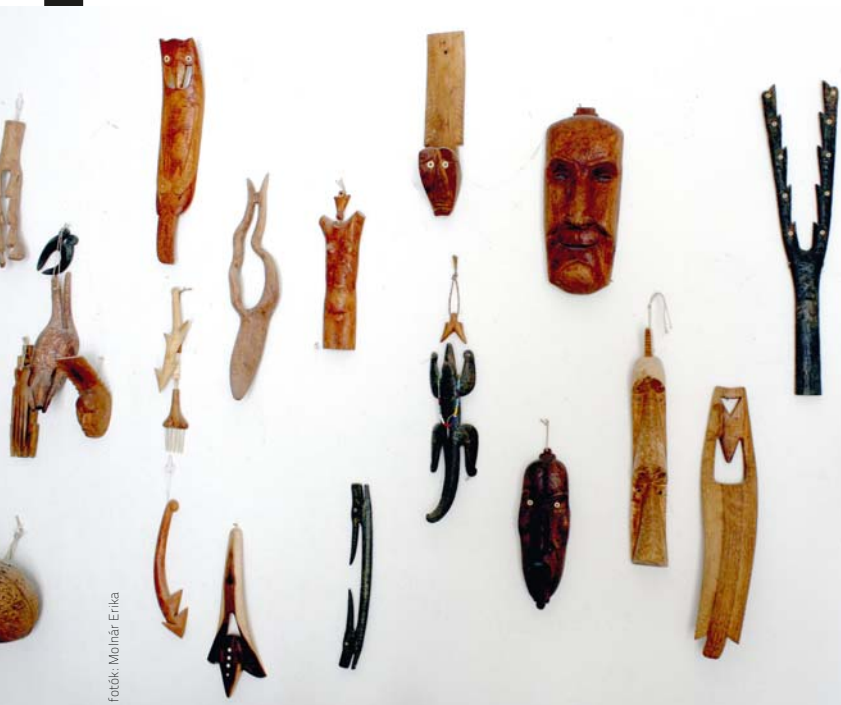
forók: Molnár Erika