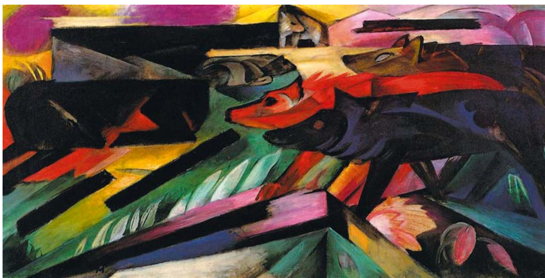
FRANZ MARC: Farkasok (Balkáni háború), 1913, olaj, vászon, 139,7×70,8 cm

Annak megértéséhez, hogy az antropomorf állatábrázolás a festészetben az irodalomhoz képest miért váratott oly sokáig magára, közelebb visz annak megfontolása is, hogy a nehezen megragadható individualitás problémája valószínűleg csak az expresszionizmus eszközeivel vált