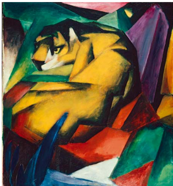
FRANZ MARC: Tigris, 1912, fametszet japán papíron, 20×24 cm

Másképpen kifejezve, a hiteles antropomorf ábrázolás és az ábrázolt állatok individualitása olyanok, mint a szíami ikrek: egymással szétválaszthatatlanul összefüggenek. Ezenkívül elengedhetetlen annak tudatosítása is, hogy az antropomorf ábrázolások mindig a fantázia termékei, ennél fogva a természetű ábrázolások és az állatportrék sohasem tekinthetők antropomorfoknak.