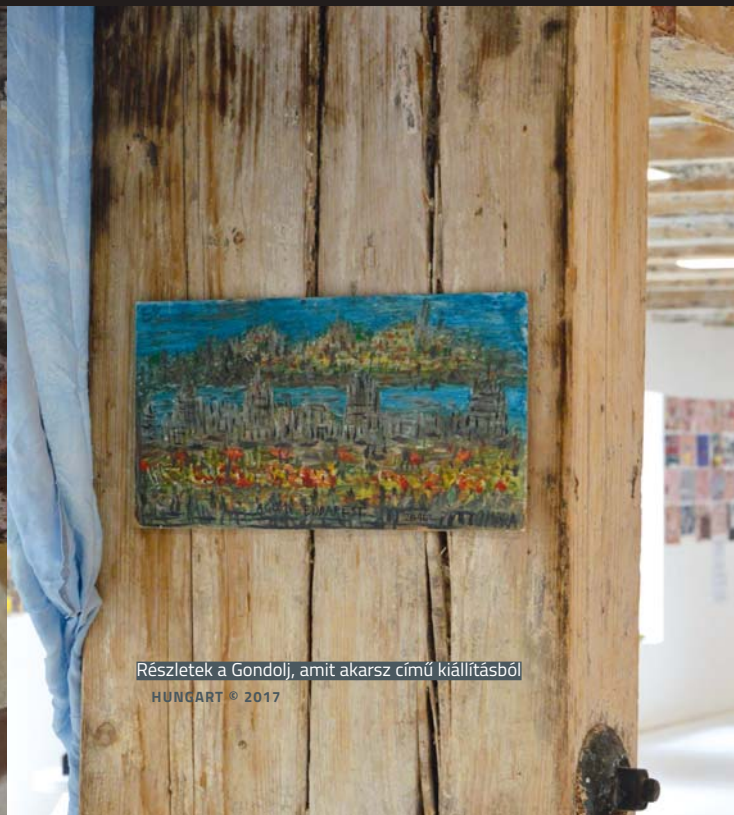
Részletek a Gondolj, amit akarsz című kiállításból HUNGART © 2017