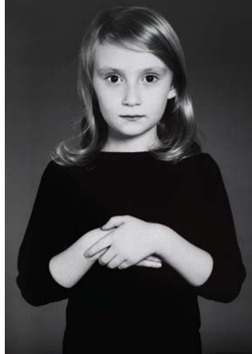
SHIRIN NESHAT: The Home of My Eyes, 2014–2015, a fotósorozat két darabja, ezüstszelatin nyomat, tinta, egyenként 152,4x101,6 cm HUNGART © 2017

A Roja című videóban a művész a szülőföld elhagyása és az új hazába való beilleszkedés ellentmondásairól beszél. A főszereplő egy fiatal iráni nő, aki miközben megpróbálja szülőhazája iránti nosztalgiáját elnyomni és egyúttal a választott otthona iránti vonakodását legyőzni, szembesül a múlt és a jelen közötti feloldhatatlan feszültséggel. A szürreális képek és a nem lineáris elbeszélés alkalmazásával a film elmossa a valóság és a fikció határait. Míg a Home of My Eyes ban Neshat közelről, az egyes emberek sorsán keresztül vizsgálja kultúrájának összetettségét, amely egy közös múltban egyesül, a Rojában a saját személyes tapasztalatát teszi meg kiindulópontnak. Ha úgy tetszik, az „archaikus” itt mindkét esetben a bonyolult, de letagadhatatlan kollektív érzelmre vonatkozik.