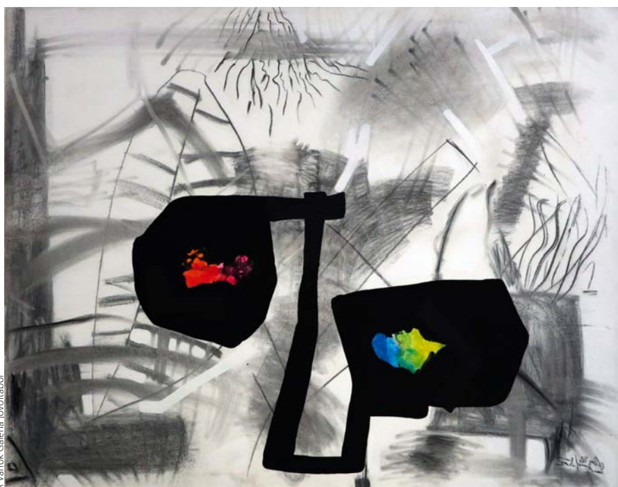
A Várkok Galéria ióvöltáéből

SZIRTES JÁNOS: A költtség, 1988, szén, vegyes technika, vászón, 115x145 cm