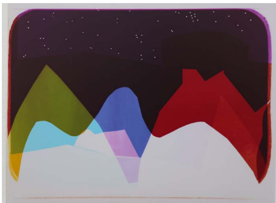
SCHILD TAMÁS: Nellys – K11, HUNGART © 2017