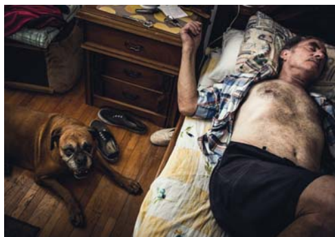
PÉCSI JÓZSEF: Palasovszky Ödön, 1926 Magyar Nemzeti Múzeum, HUNGART © 2017

Tapuicaca-k vagyunk, titkoljuk igazi arcunkat? A Deák 17 Galéria (a Budapesti Francia Intézet támogatásával) Maia Flore Imagine France című kiállításával Franciaország gyönyörű kulturális helyszíneire kalauzol. A huszonnyolc fotóból álló sorozaton egy elképzelt karakter jelenik meg mindig az adott helyszínhez alkalmazkodva a maga költői és meglepő módján. Modellként és megfigyelőként éled újra a műemléki helyszínén. A Platán Galéria adott otthont Anna Orłowska és Puklus Péter BELONGING(S) című kiállításának. A fotósorozat újragondolja Közép-Európa történelmét és regionális kontextusát, az identitás keresését.